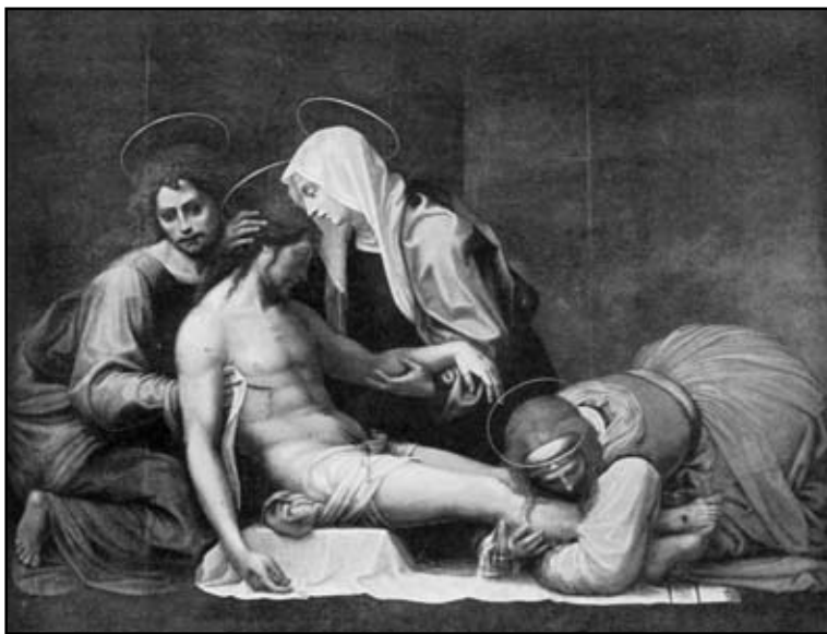
Фра Бартоломео. Покладення до гробу

крокував далі, проте голос чітко відраховував: “Сім, вісім.” Тоді старий під впливом Божого натхнення промовив благально: “Хто ти, що йдеш за мною?” Несподівано перед ним постало прекрасне усміхнене дитя, яке відповіло: “Я - твій Ангел Хоронитель і з дозволу Божого рахую твої щоденні кроки на Службу Божу і до Св. Причастя. Однак нині іду за тобою