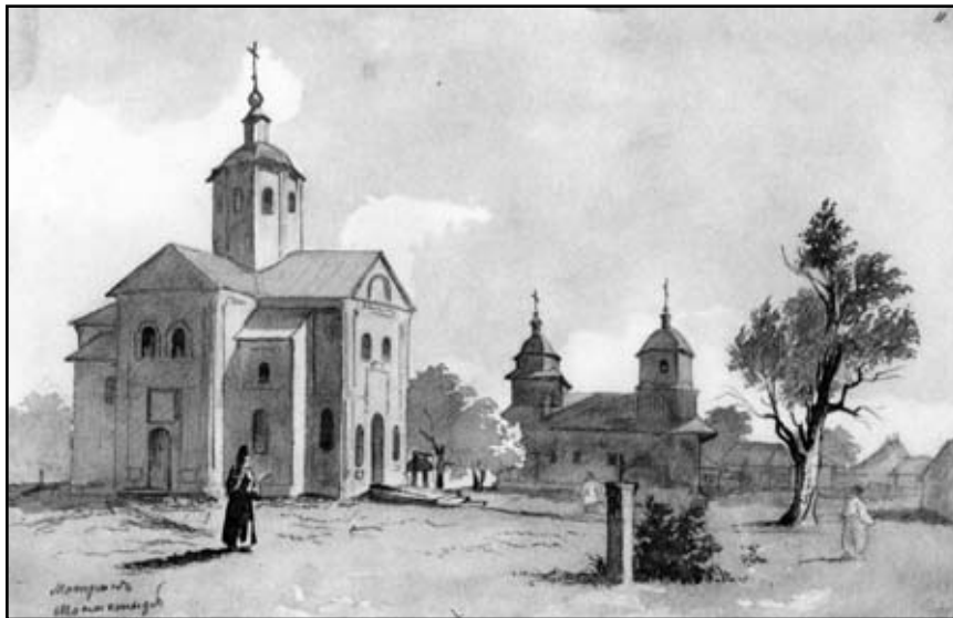
Т. Шевченко. Мотрин монастир, 1845

Хіба можуть собі уявити професори і студенти філософії цю науку без св. Августина, Ломбарда, Альберта Великого, св. Бонавентури, Томи Аквінського? Це були не тільки великі філософи, але й взірцеві католики!