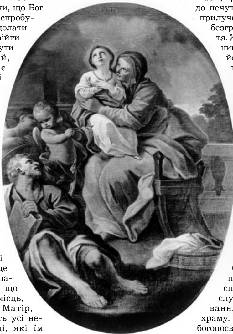
III. Чехович. Юність Марії

храму Пресвятої Богородиці є символом богопосвяченого життя. В Єрусалимському храмі Діва Марія дала обітницю непорочності. Так само