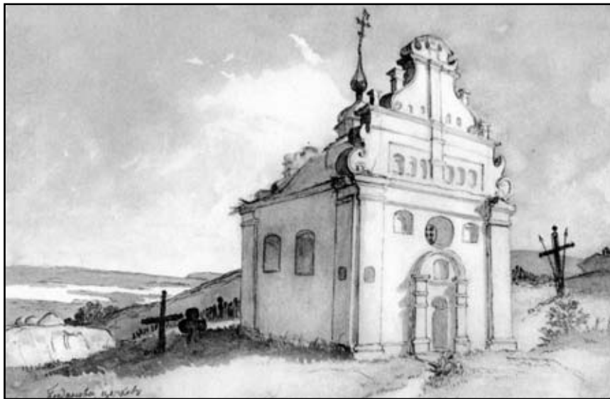
Т. Шевченко. Богданова церква в Суботіві, 1845

У середньовіччі Європа потрапила в ярмо варварських народів, але Церкві вдалося