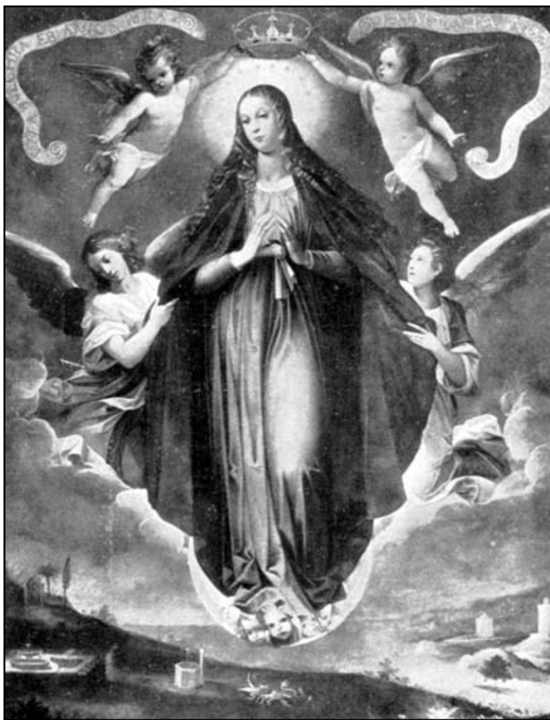
Х. де ляс Роелас. Коронація Марії

огляду на Її виняткову досконалість. Оточуй шаною Кивот твого Бога. Поважай і ціную Мій Трон так, як Я його ціную. Не питай: “Чому Найвищий наділив Її таким почесним тронм у Своєму Небесному Спадку?” Глянь! Я не тільки поставив Її Царицею Моїх Ангелів і Моїх створінь, але й призначив бути Мені Тронм.