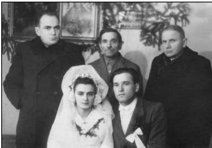
Галицька родина. I-а половина 20-го століття

Кароль Войтила, теперішній Святійший Отець, перш ніж стати єпископом і кардиналом, був душ-пастирем у невеликій сільській па-рафії, писав поетичні та драма-тичні твори, потім був професо-ром, ученим, який досліджував, зокрема, проблеми людської особистості. Один з драматичних творів він назвав “Перед крам-ницею ювеліра” . Відомо, що юве-лір виготовляє обручки, котрі ос-вячуються під час обряду вінчан-ня і є знаком, що людина - чоловік чи жінка, не належить уже собі, а є даром для своєї пари. Обручка - це символ вірності, символ Бо-жого благословення.