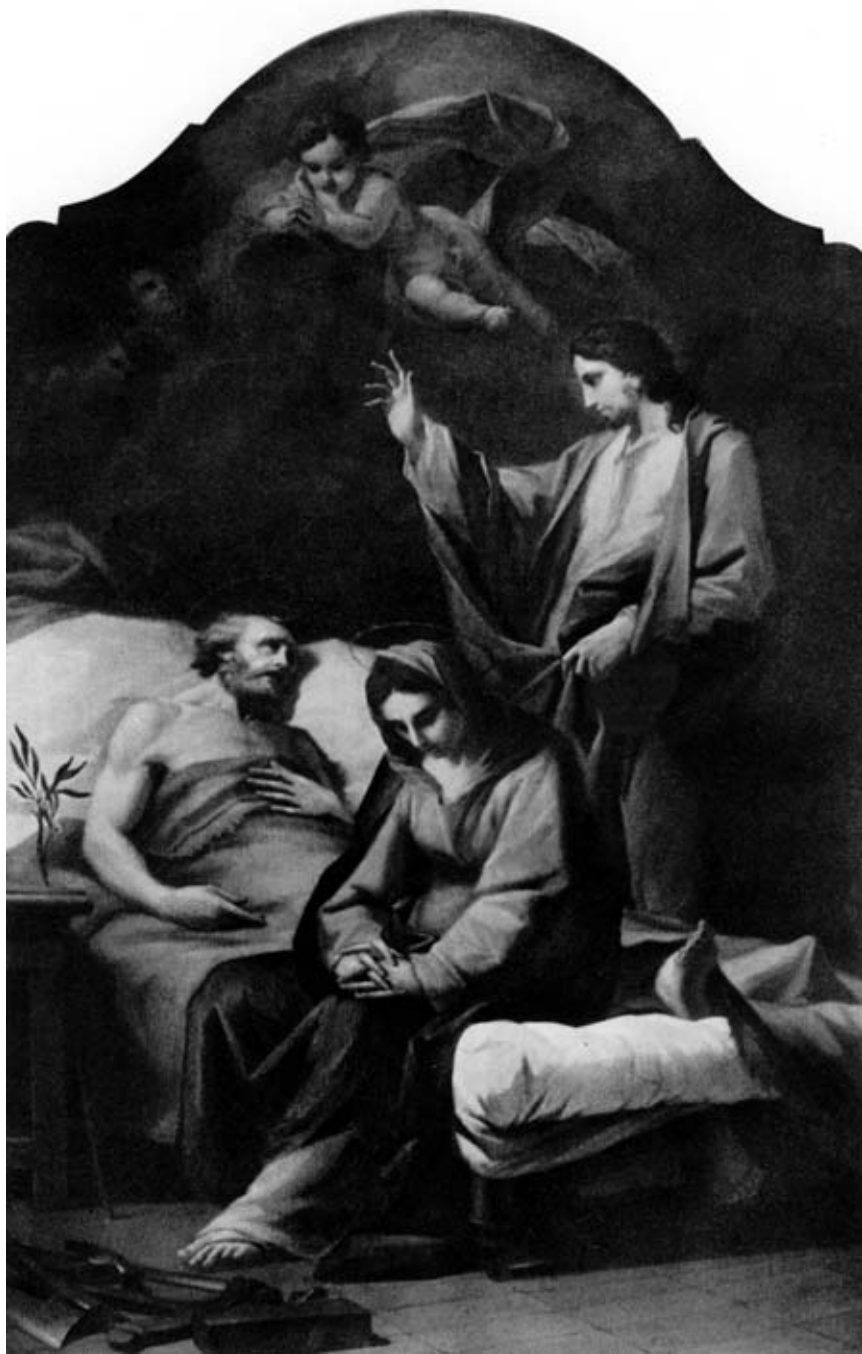
Т. Куни. Смерть св. Йосифа, бл.1758

Радість життя б'є із християнських догм. Церква перенесла стільки гонінь, і все ж залишилася сильною і непереможною, бо містить у собі знамена божественності, єдності, святості! Християнство заклало підвалини родини, суспільства, держави, науки, мистецтва. Воістину, як сказав Папа Лев XIII, що Церква - це “матір цивілізації” .