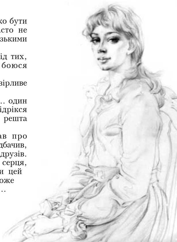
Б. Сойка. Портрет дівчини

Дозволь мені пізнати і прийняти цю правду, що цілковито віддавшись іншій людині, ми відчиняємо серця перед Тобою. Амінь.