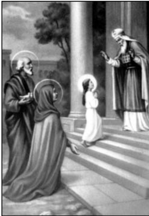
Вхід у храм Пресв. Диви Марії

події передую невеликий земний шлях, пройдений Марією з батьками, від родинного дому до храму в Єрусалимі. Та є інший вимір цього шляху,