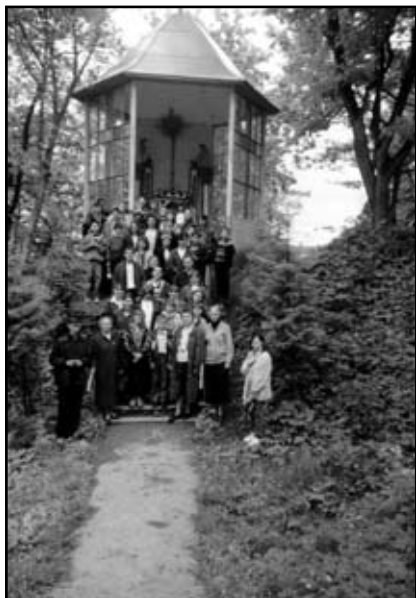
На прощі у Зарваниці