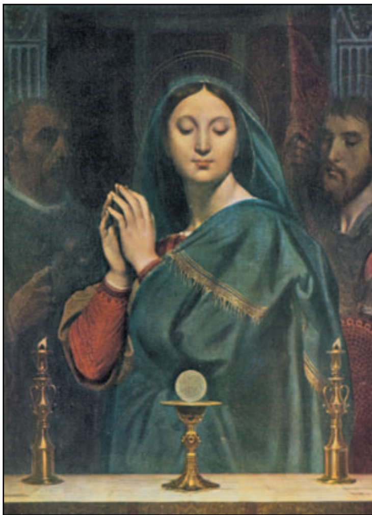
Ж. Енгр. Мадонна перед чашею з Причастям, 1841

Гадав, якщо це йому не допоможе, то й не зашкодить. Проте, як тільки він прийняв Ісуса, почув внутрішній голос: " Піди, охрестися! " Вражений парижанин розказував, що голос наче лунав зсередини. Вийшовши з церкви, він намагався про це не думати, але під час обіду вдруге почув у душі голос: " Піди, охрестися! " На прогулянці це повторилося знову. Тоді юнак, зовсім знесилений настирливістю того голосу, попросив свого товариша завести його до священика... Який кінець цієї історії, неважко здогадатися. Вона почальна, бо допомагає усвідомити, яке особливе місце в духовному житті повинна займати Пресвята Євхаристія,