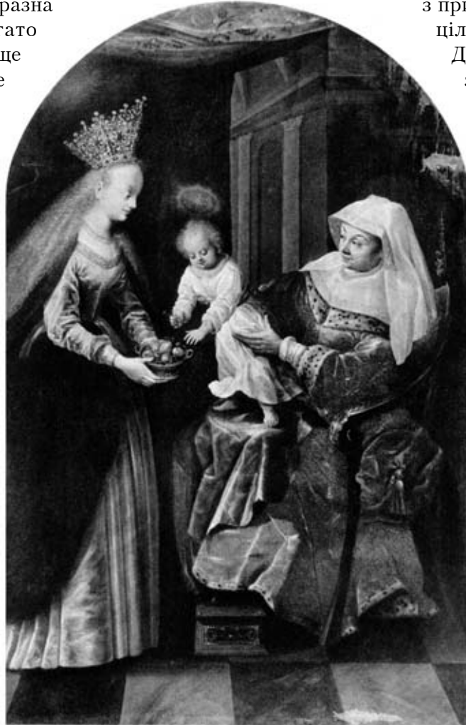
Б. Стробель. Утрох зі св. Анною, 1639