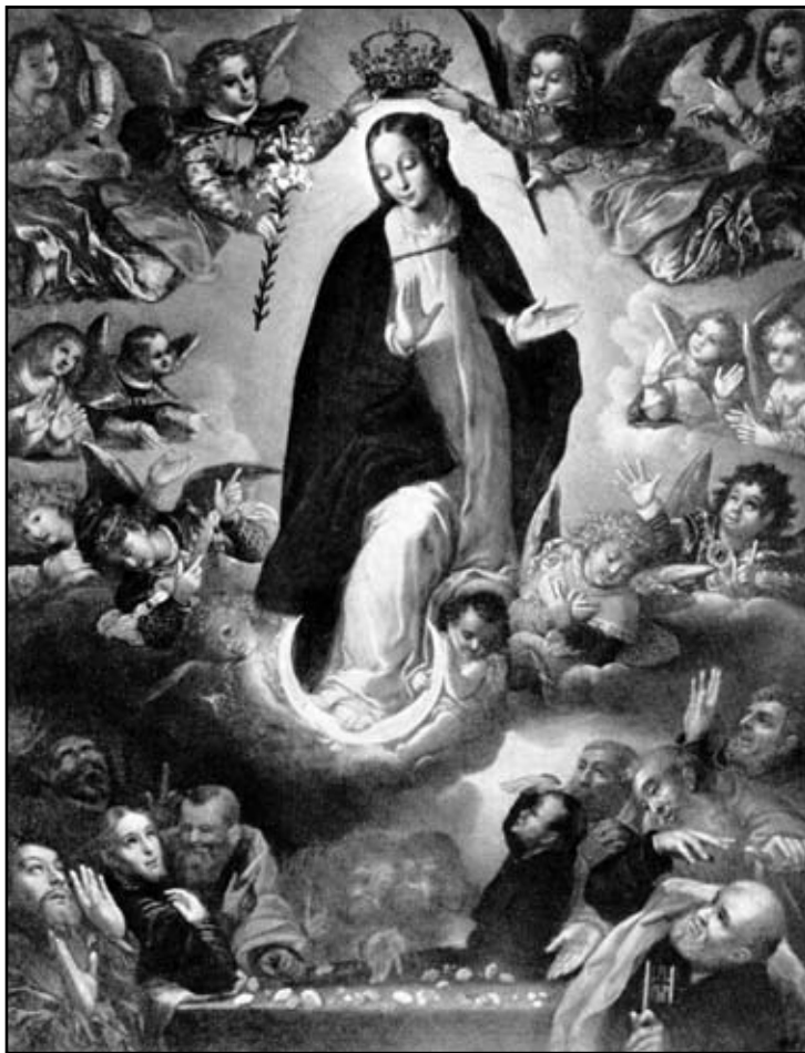
Г. Хан. Внебовзяття Марії, 1618

Вона - Моя і ваша Мати, Вона - з'єднуюча нитка. Моє благовоління на тих, хто відчуває істинну любов до Неї, яка неуханно молиться за всіх.