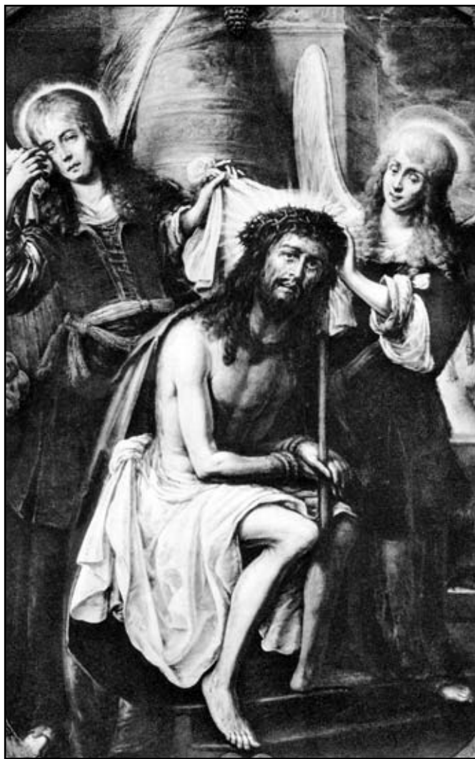
Невідомий художник. Христос з ангелами, які оплакують Його, 1680

По тому катувала цариця Катерина II і її наступники. За-