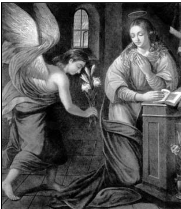
Невідомий художник. Благовіщення, біля 1620

Так, перебування з Богом було життям для Марії. Тому то у страшну несамовиту годину Хресної Дороги і покладення до Гробу, коли Небеса замкнулися над Умираючим і над Пронизаною мечем болю,