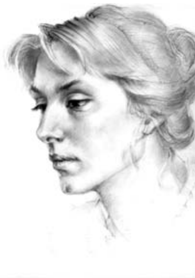
Б. Сойка. Жіноче обличчя

Організація "АСОЦІАЦІЯ ЗА ЖИТТЯ" , яка діє у місті Львові, пл. Соборна, 3, проводить співбесіди з матерями та з іншими членами сім'ї, в яких