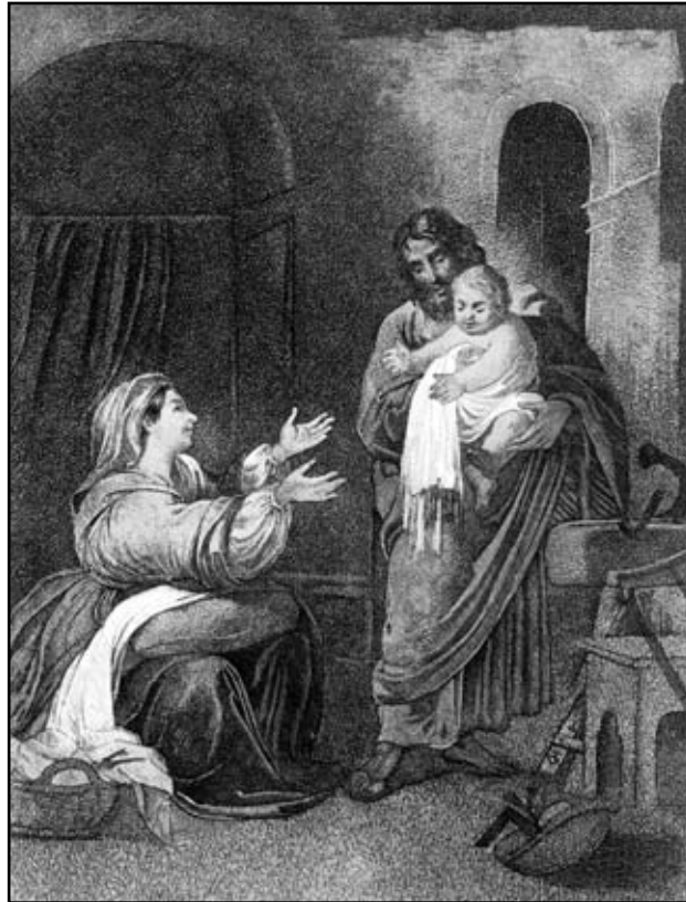
Т. Шевченко. Свята Родина, 1858

в) Мистецтво, як і християнство живе глибоким внутрішнім життям. Геніальні дум-