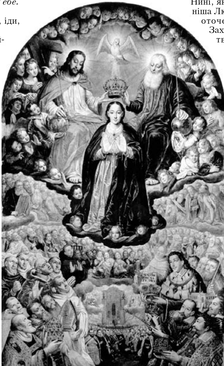
Г. Хан. Коронація Марії, близько 1624