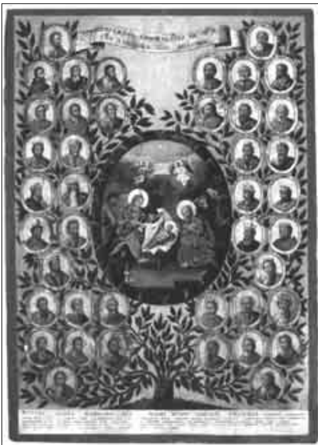
Ікона “Різдво з родовидним деревом Ісуса Христа”, XVIII ст.