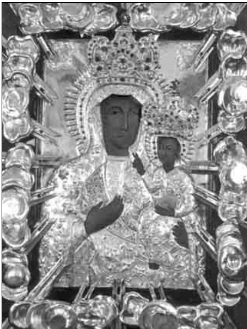
Улашківська чудотворна ікона Матері Божої. Богородиця Одигітрія. I-ша пол. XVII ст.

Наприкінці XIX – першій половині XX ст. – Улашківський монастир із своєю чудотворною іконою Божої Матері був для східного Галицького Поділля другою Зарваницею. В 1896 р. до нього було долучено василіянський осідок с. Михайлівки, що над Збручем.