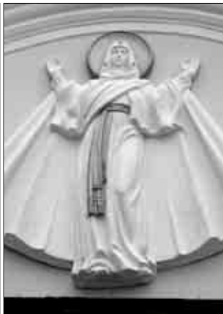
Матір Божя Нерушимої Стіни (барельєф, Страдч, Львівська обл., скульптор Ю. Савко, 2006)

паломництва до Люрду, Фатіми, Меджугор'я, Пацлави. Усі вони твердять, що Страдецька Кальварія є неповторна. Цю неповторність зумовлює не лише глибока молитовна духовність самої Хресної Дороги, особливість практикування молитви до Отця Небесного через Рани, Кров, Серце, Голову, Хрест, Терня Ісуса за посередництвом терплячих душ із Чистилища, але й наявність на кожній стації фігур, які допомагають глибше сприйняти терпіння Спасителя і Марії. Жаль, що на Хресній Дорозі не поставили XI стацію "Поцілунок Миру." Я читала книжку с. Йосифи Менендес "Поклик Любові". У ній вона описує цю подію із життя Спасителя, яку бачила під час візії. Вражаючи за змістом і значенням сцена.