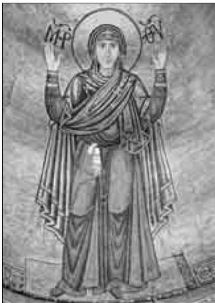
Матір Божя Нерушимої Стіни (Київ, Софія)