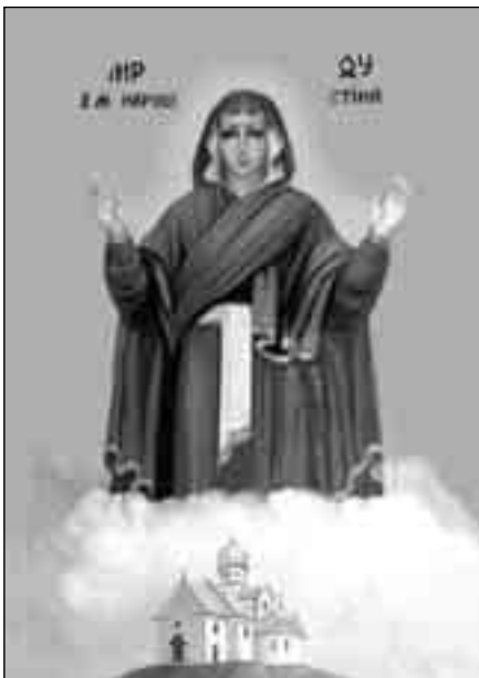
Матір Божя Нерушимої Стіни (Страдч, Львівська обл.)