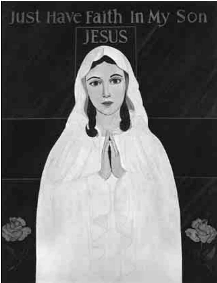
Образ Матері Божої Милостивого Захисту. Фернандо Карті. (Див. на кольорову вкладку)

путників з Києва та Львова саме до тієї ікони, яку Вона призначила Україні. Я вірю, що ця ікона сповнить своє чудо в Україні. На згадку про цю подію я подарувала о. Степану вишиту сріблом ікону Гошівської Матері Божої. Це його дуже схвилювало, нагадало йому його молодість та часи перебування у Гошеві. Він розчулився і подарував мені свою ікону Матері Божої з Чашею і Гостією в руках, одну із тринадцяти ікон Фер-