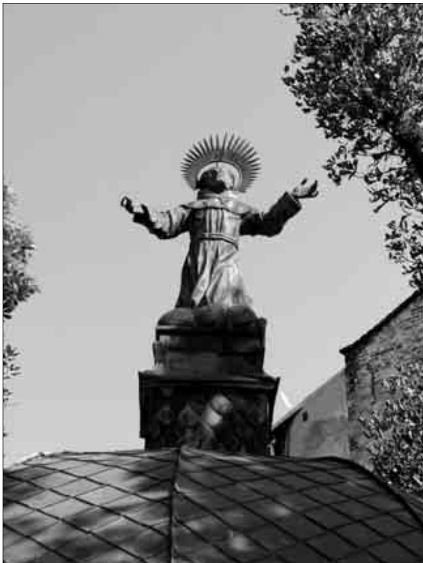
Фігурка св. Яна з Дуклі на ротонді біля церкви св. Андрія у Львові

відображає життя самого Фернандо, тут темряву, в якій він жив. Хрест на темному фоні – це Хрест людини від Бога, який вона повинна пронести через усе життя з любов'ю до Голготи. Ісус просить усіх нас, щоб ми не боялися його нести, не боялися просити щось у Нього, бо Він вислуховує всі прохання. Спаситель закликає сміливо брати свій хрест і йти за Ним. Нам потрібно навчитися просити по-справжньому.