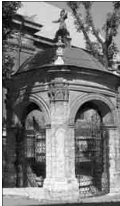
Ротонда з криничкою біля церкви св. Андрія у Львові