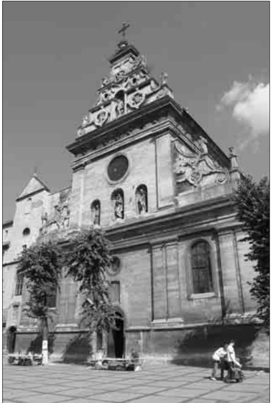
Церква св. Андрія у Львові