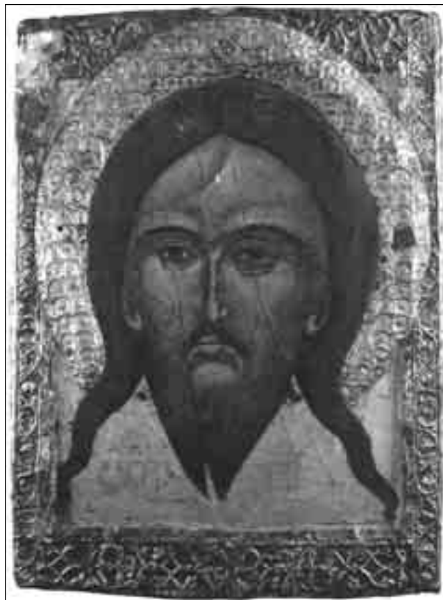
Ікона “Спас Нерукотворний”. XVI ст.

Повернення Ісуса вже дуже близьке! Радісне запевнення Марії пронизує всі Її послання: “Близьким є Його славне повернення. Нове світло і вогонь відновить цей світ”. “Прагну благовістити нині усім Моїм дітям радість: близьким є вже час Його славного повернення!” У зв’язку з тим, що цей день є близьким, Марія заохочує нас до чування разом з Нею: “Чувайте зі Мною в очікуванні в тих останніх часах вашої дуже довгої Великої Суботи. Близькою є бо хвилина, коли Мій Син, Ісус, повернеться на небесних хмарах у всій красі Своєї Божественної Хвали”. Уже невдовзі завершиться теперішній час терпіння: “Забудьте про