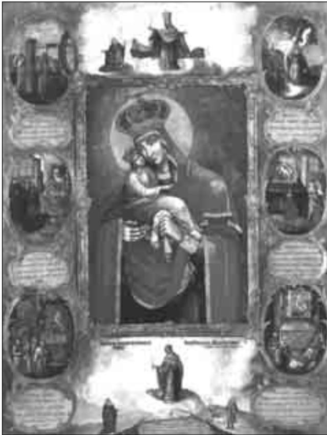
Ікона “Богородиця Почаївська з чудесами”, XVIII ст.

“В період тих десяти років закінчиться проповідуваний вам через Святе Письмо час великого утиску, котрий повинен надійти перед другим пришествям Ісуса.”