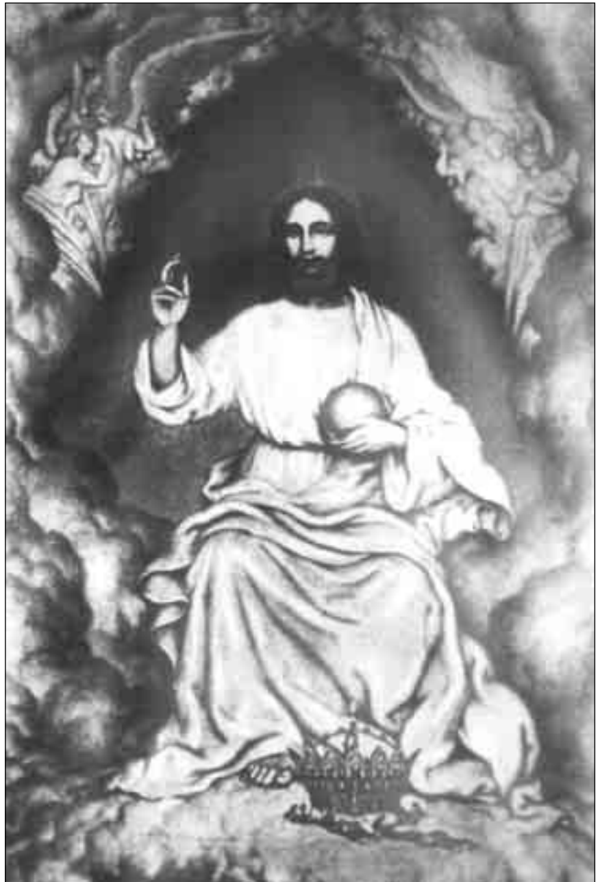
Образ Отця Небесного

А ви, що перебуваєте в правдивому Світлі, скажіть їм, як солодко живеться в Правді! Скажіть же тим християнам, тим дорогим створінням, Моїм дітям, як солодко думати, що існує Отець, який все бачить, знає про все, про все турбу-