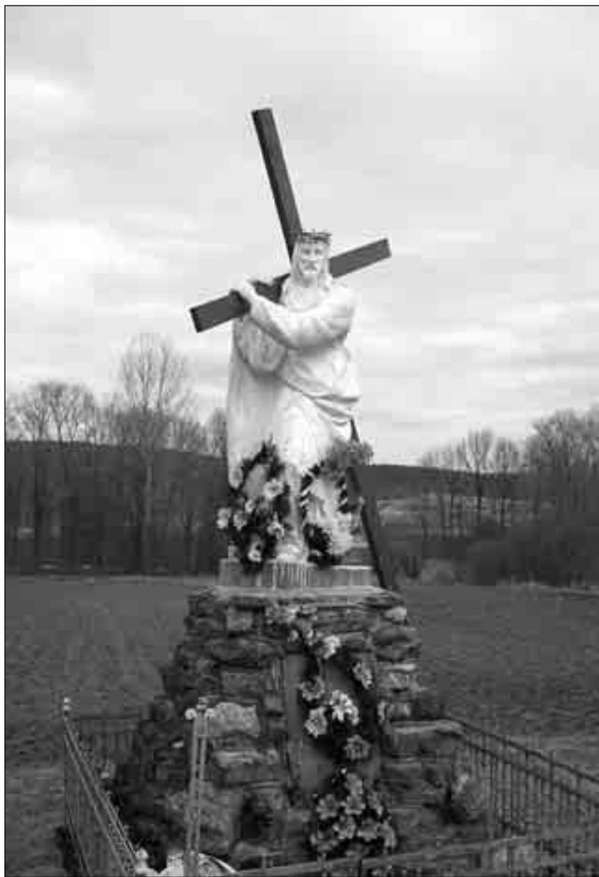
Фігура Ісуса Христа з Хрестом поблизу Хирова (Старосамбірський р-н, Львівська обл.)

З виходом на волю Митрополита Йосифа Сліпого в лютому 1963 року Кир Бучко переводить о. Івана працювати до нашого Ісповідника. Отець Іван працював з Патріархом аж до його смерті 1984 року як його секретар, канцлер і член