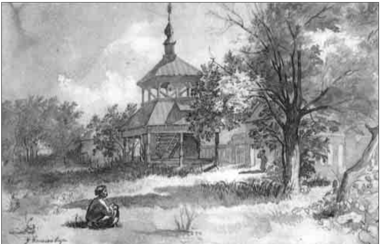
Т. Шевченко. У Василівці. 1845

Ісус постійно нагадує о. Оттавіо, що життя поза гробом триває далі: "Ті всі, які відійшли до вічності, перебувають або в Чистилищі, або в Небі. Вони продовжують лю-