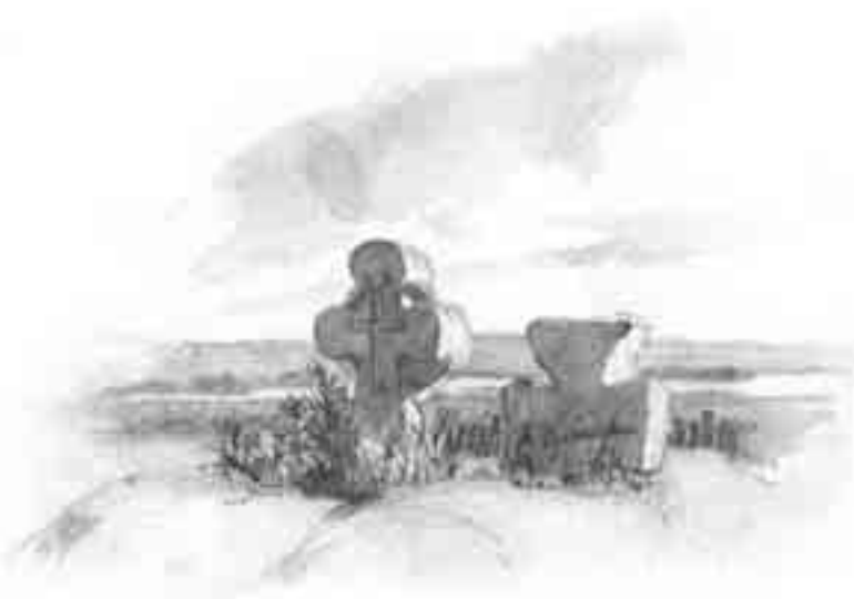
Т. Шевченко. Кам'яні хрести в Суботіві. 1845

В останню мить Свого життя на Голготі Ісус Христос вимовив слово “звершилось”. Це був Його останній акт найбільшої Любові до нас, це був акт Відкуплення. Отож, нехай і для кожного з нас це слово стане останнім у ділі Відкуплення нашого Господа Ісуса Христа!