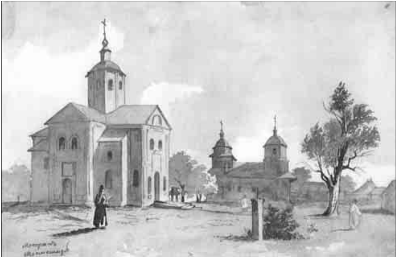
Т. Шевченко. Мотрин монастир. 1845

збираються, щоб прославляти Господа. Наведемо один приклад, який свідчить про те, як розмови у святих місцях не подобаються Богові. В одному монастирі проживали дві молоді монахині: с. Гертруда і с. Магдалина любили під час відправлення обрядів поговорити між собою. Першою захворіла с. Гертруда і невдовзі померла. Її поховали під вівтарем. Якось під час вечірнього набожества с. Гертруда з'явилася с. Магдалині, клякнула перед вівтарем, як звичайно, і присіла біля с. Магдалини на своєму місці. Сестра Магдалина з переляку втратила свідомість, і впала на підлогу. Опісля, прийшовши