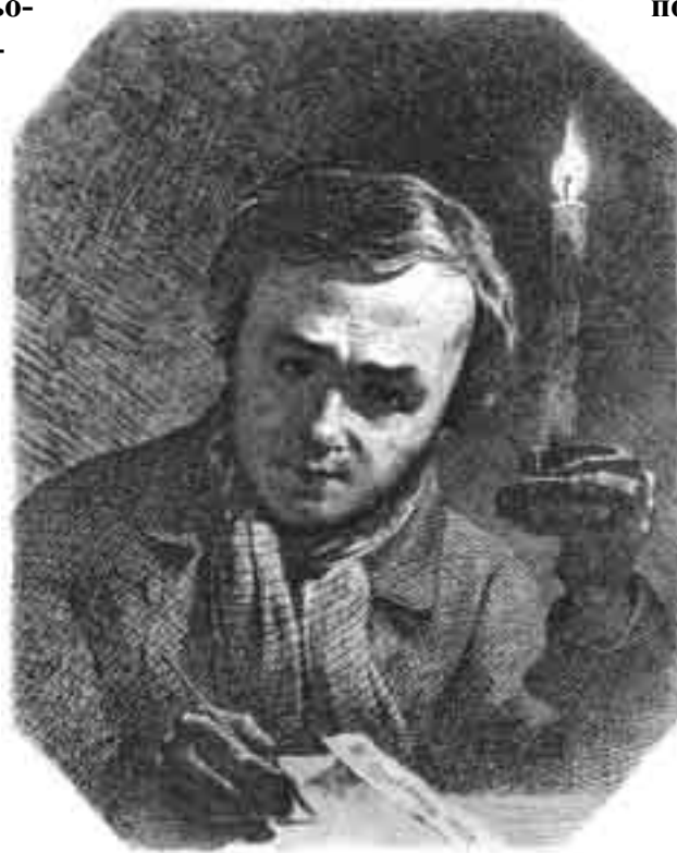
Т. Шевченко. Автопортрет з свічкою, 1860

потрібно нагадувати собі й своєму серцю, яка кров тече в наших жилах? Треба! Бо губимо і забуваємо наші скарби, наші джерела, наш дух. Не пам’ятаємо історії, розгубили спадщину. Ми – не перекотиполе, ми – на своїй