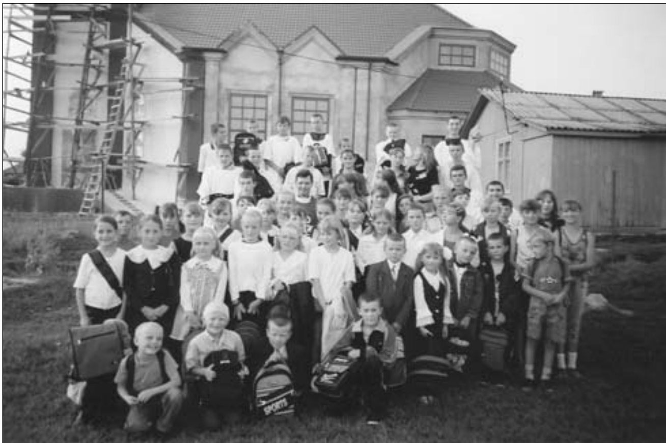
Діти України (с. Михайлівка Шаргородський р-н Вінницька обл.)