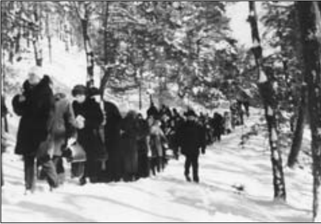
Страдч. На Хресній Дорозі

Тільки християнство може породити витончену і гарячу любов, здатну до героїчного посвячення Богові. Джерелом цієї любові є правдиве пізнання Бога.