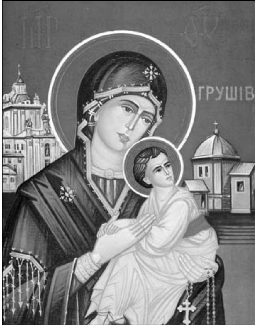
Ікона Грушівської Матері Божої, худ. Йосип Тереля

Тому хочу звернутися до всіх: послухайте мене! Хочу втілитись у Божу Волю разом з Ісусом і постукати у ваші серця, попросити у вас, як маленька