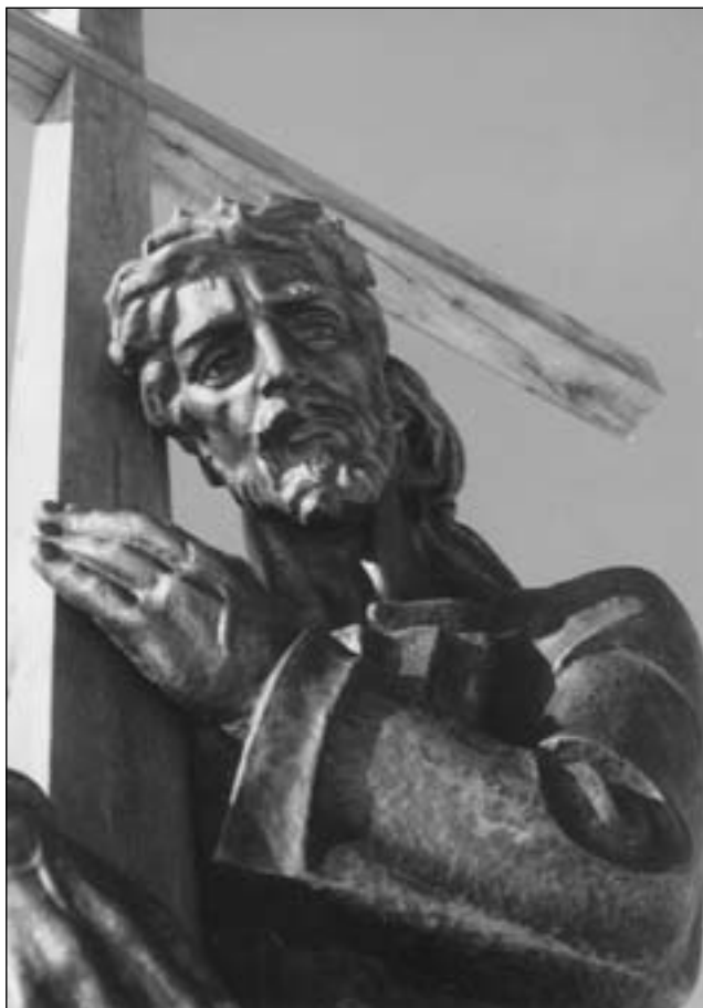
Страдч. Перша стація Хресної Дороги (фрагмент). Скульптор Юліан Савко

Бог?.. Без сумніву, це слово вимовляємо найчастіше! Бог є основою всього, об'єктом наших молитов, джерелом наших надій. Сьогодні вже навіть не задумуємось над тим, що Ісус