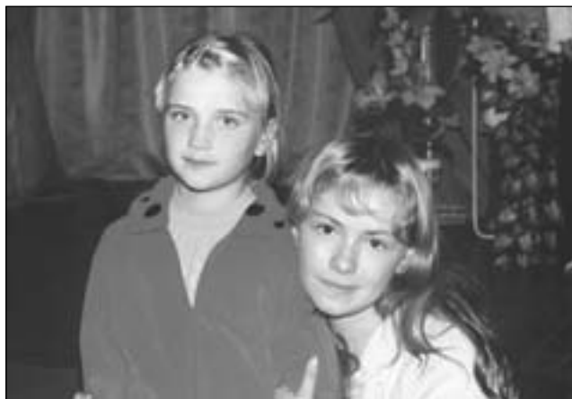
Діти України. Тисмениця