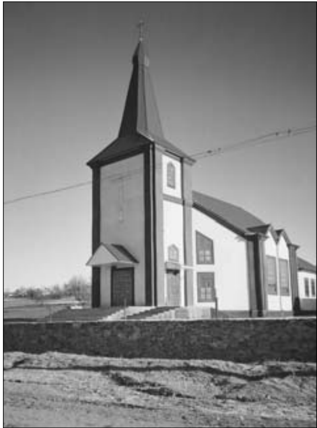
Храм Архангела Михаїла (с. Михайлівка Шаргородський р-н Вінницька обл.)