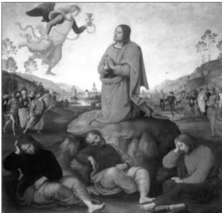
П'єтро Перуджіно. Моління про Чашу, 1485 р.

О мій Боже, Ти, що посідаєш у невимовній повноті все досконале та гідне любові, зітри в мені всяку гріховну, чуттєву та надмірну любов до створінь. Запали у моєму серці найчистіше полум'я Твоєї Любові, так,