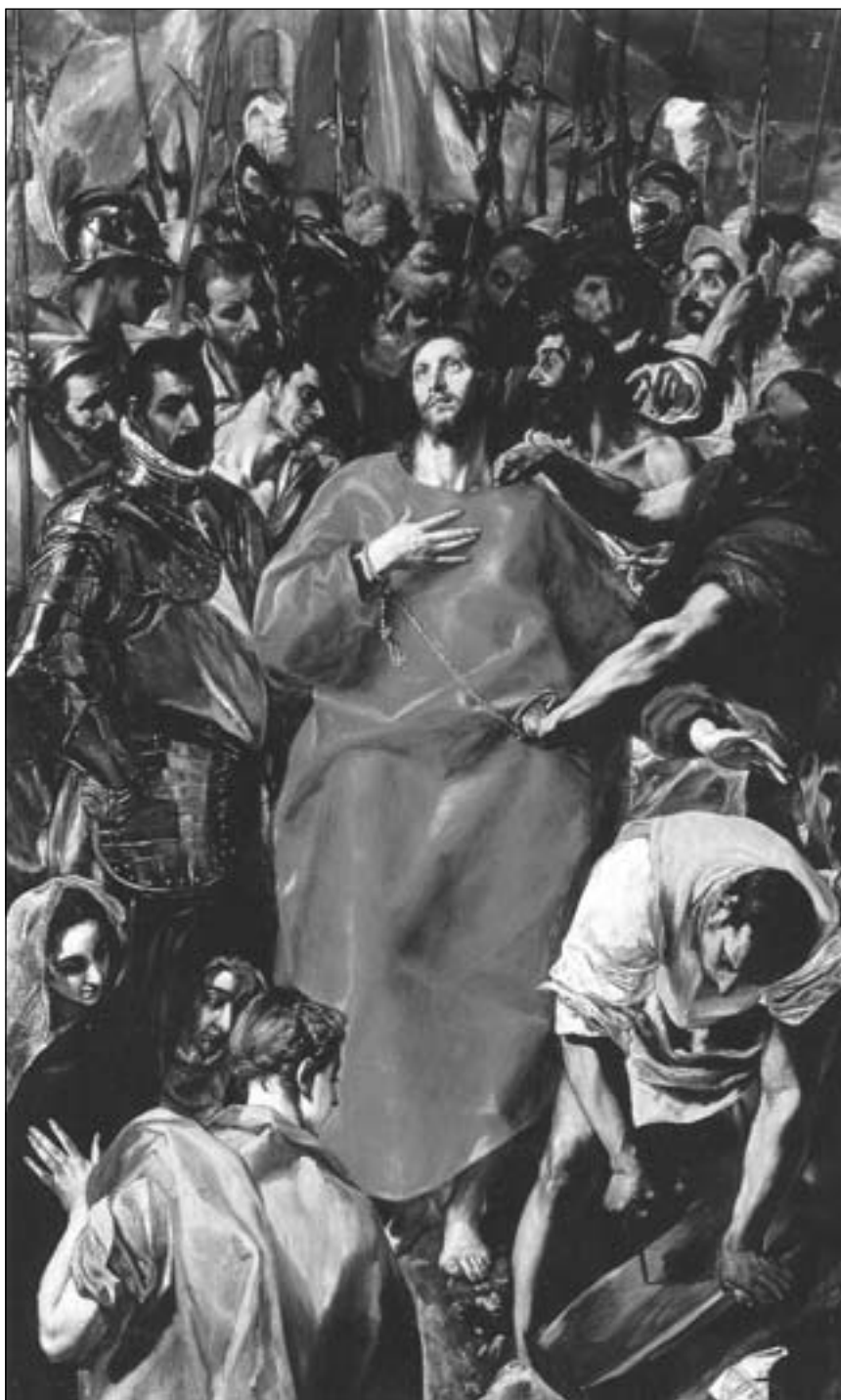
Ель Греко. Зривання риз з Христа, 1577-79 рр.

Хто ж тоді усмиряє цей гнів нескінченний і хто ж відвертає від грішників страшну помсту Божу? Лише Ісус Христос, Бог-Людина, Кров якого закликає до змилювання над людьми. Хоча волення за гріхи про помсту таке велике, що проривається аж у Небо, проте голос Крові Ісуса, пролитої за нас,