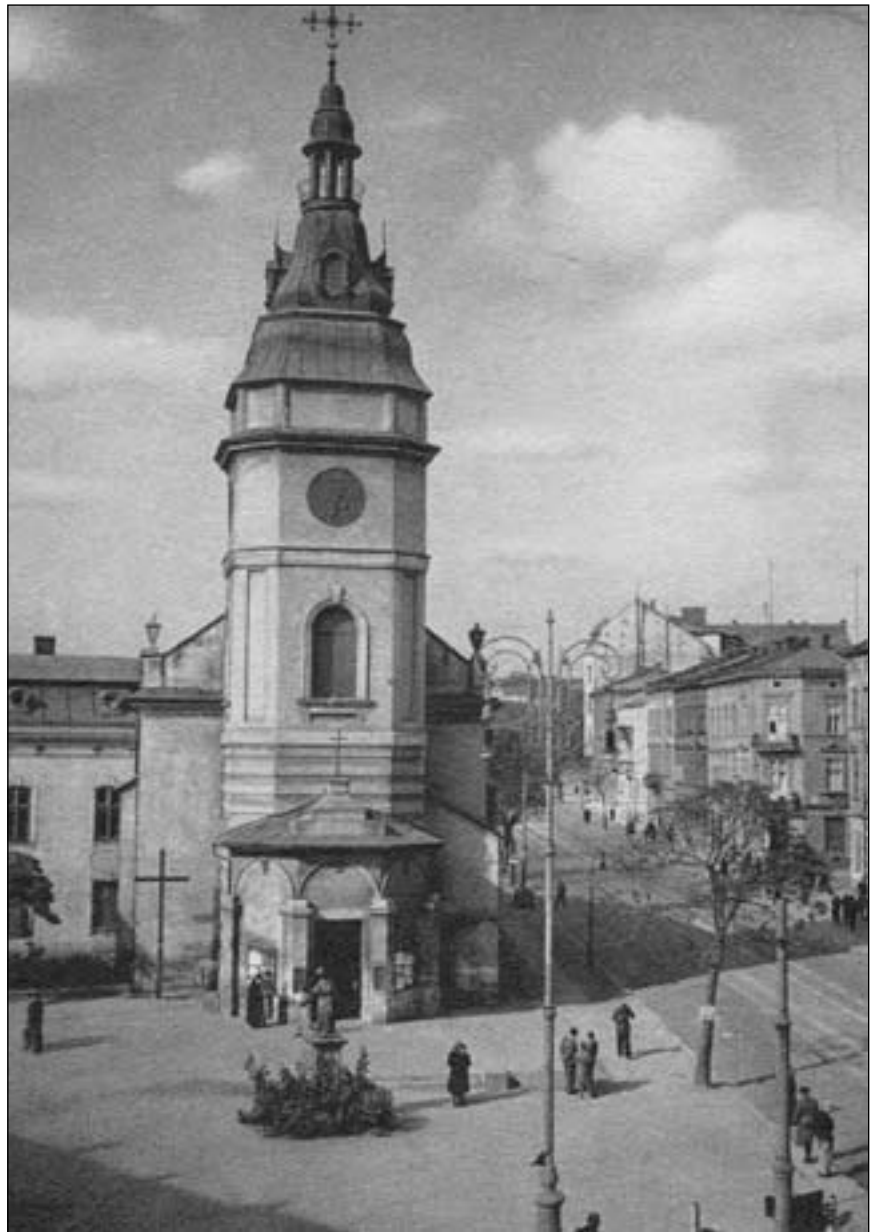
Церква св. Анни у Львові з пам'ятником св. Анні перед храмом, 1930 р.

Ти бачиш у світі зло і тобі здається, що ти безсилий проти