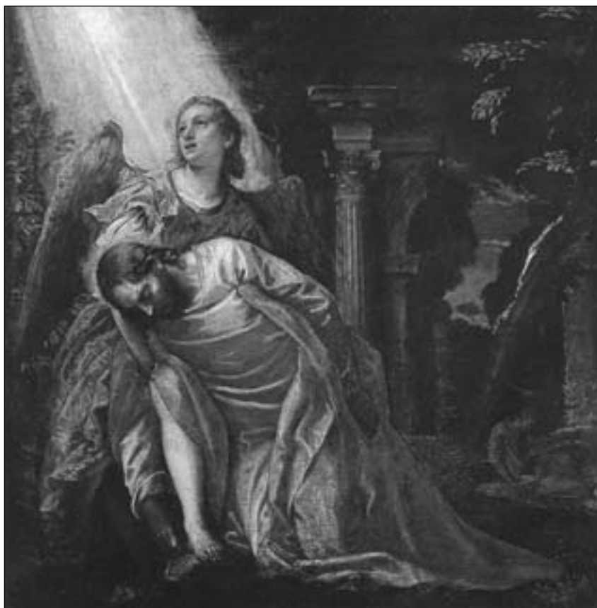
Паоло Веронезе. Христос в Гетсиманському саду, біля 1583-84 рр.