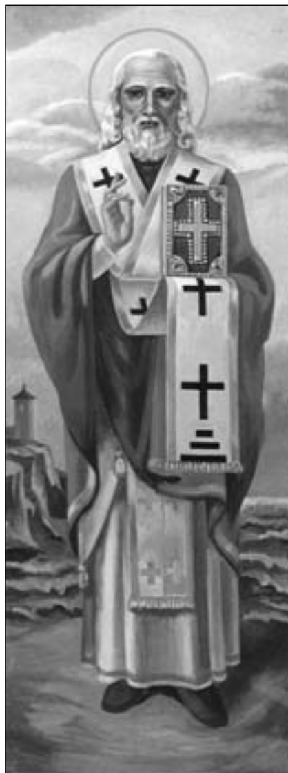
Св. Миколай. Худ. Олена Шаховська

ніжний і зворушливий, голос нашого солодкого Ісуса, який просить завжди, навіть плачучи: “Візьміть для вашого жит-