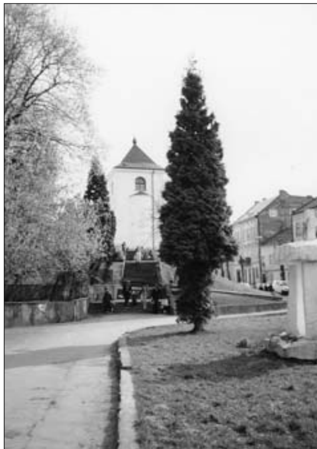
Вид на дзвіницю церкви св. Онуфрія у Львові

Ми бачили, що в структурі нової Європейської Комісії немає одного італійського міністра. Його „помилкою” була заява про те, що практика гомосексуальних стосунків та одностатевого шлюбу є гріхом. За це його розкритикували і звинуватили у позбавленні прав людей думати інакше. Отож цього католицького міністра, друга Папи, виключили зі складу нової Єврокомісії. Який парадокс! Гомосексуалісти дискриміновані, а він — ні?!