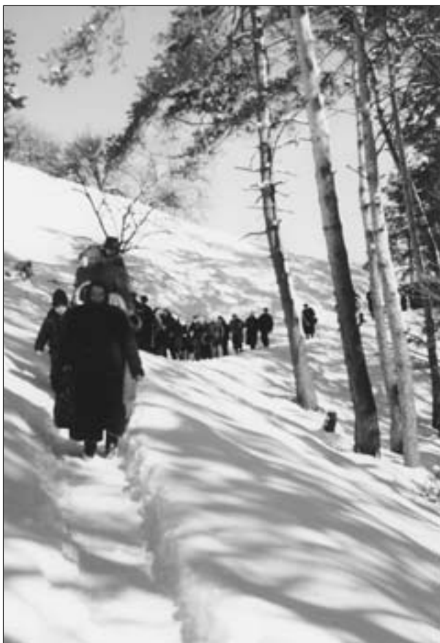
Страдч. На Хресній Дорозі

Ця теза є основою християнства. На теоцентричній науці Христа Господа збудована християнська віра, мораль, з неї впливає наша любов до Бога і ближнього, з цієї тези черпаємо силу до боротьби з труднощами, спокусами, гріхами, ця наука відкриває нам джерело надії на вічне життя і вічне щастя.