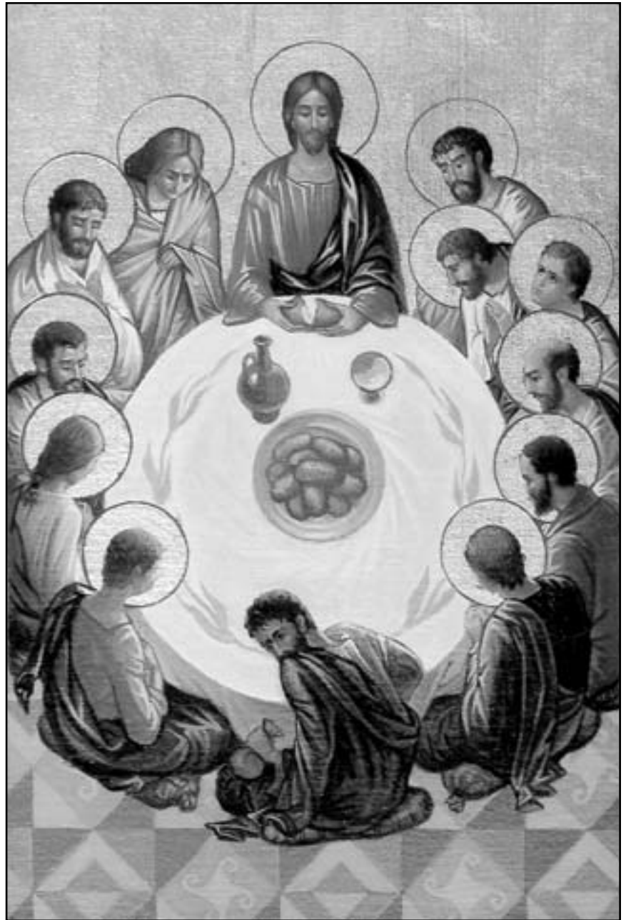
Тайна Вечеря (худ. Юрій Дрозд, 2003 р.)

Історик Сохомен розповідає нам випадок із життя Йоана Золотоустого. Якось він служив Літургію, в церкві було багато людей. Одна жінка-грішниця, побачивши, що християни приступають до святого Причастя, подумала собі, що й вона може це зробити. Але вона не розкалася, не пішла до сповіді, перебувала у важкому гріхов-