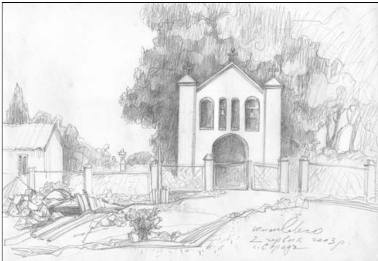
Вид на дзвіницю у Страдчі, Львівська обл. (худ. Юліан Савко)

Культ Матері Божої на Сході прадавній. Усі великі Марійські празники зародилися на Сході, і тому почитання Богородиці перейшло в кров та свідомість усіх вірних Східної Церкви... Вони так вросли в культ Божої Матері, що того, хто Її не по-