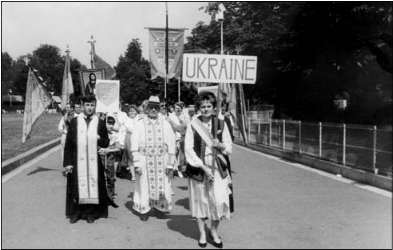
Прочани з України у Люрді (Франція)

Христа, котрий виявив і викрив діяльність сатани та переміг його силою Своєї Любові й Жертви.