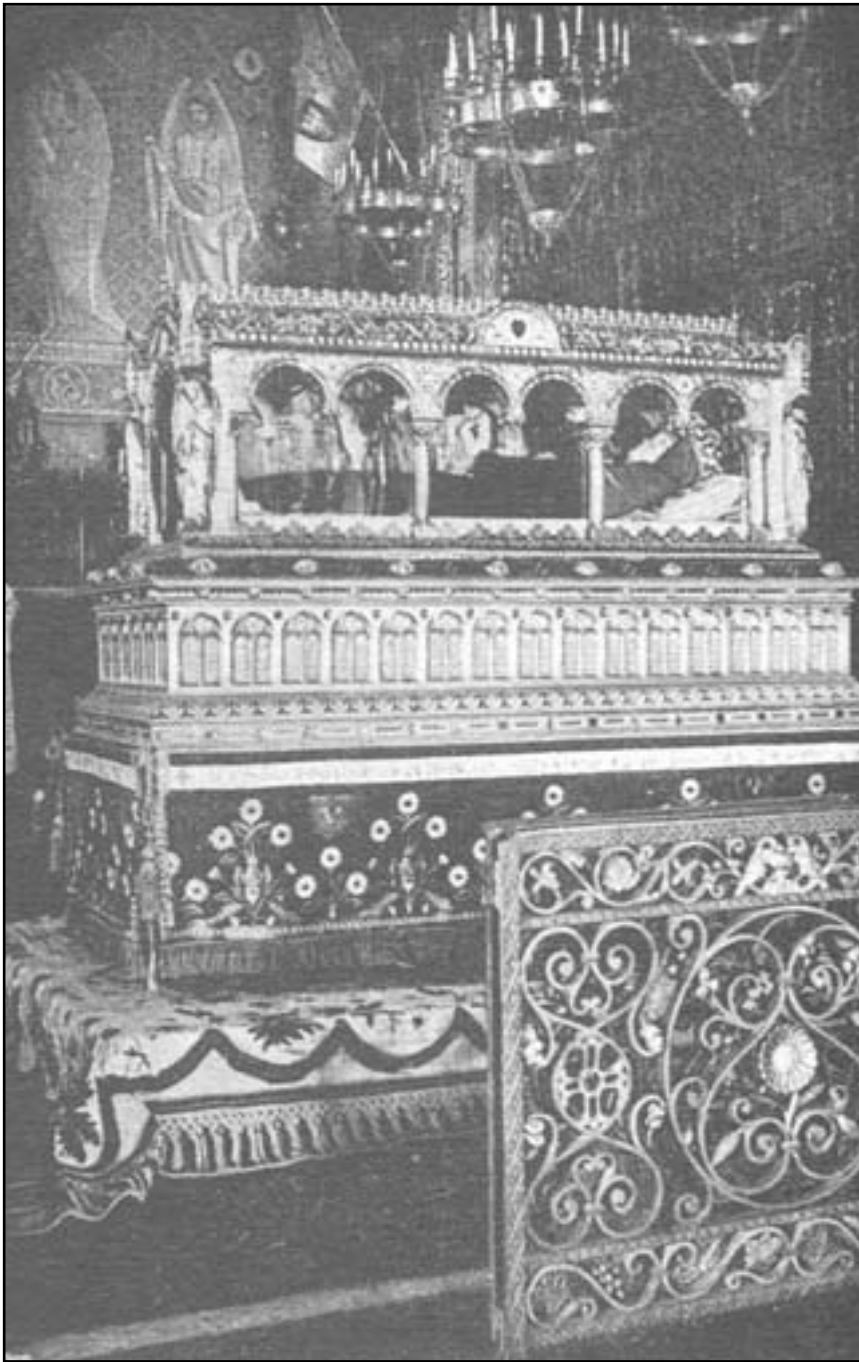
Домовина св. Маргарити Марії Алякок в Паре ле Моньяль (Франція)