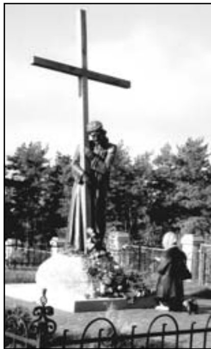
Біля Ісуса у Страдчі

превеликий жаль (як зазначалося в журналі “Діти Непорочної” № 6, 2003.), немає віри як серед людей, так і серед священників особливо щодо з’явлень Матері Божої на Закарпатті в урочищі Джублик, біля Дрогобича, Гошівського монастиря, де я буваю на нічних адораціях і відчуваю Їхню присутність.