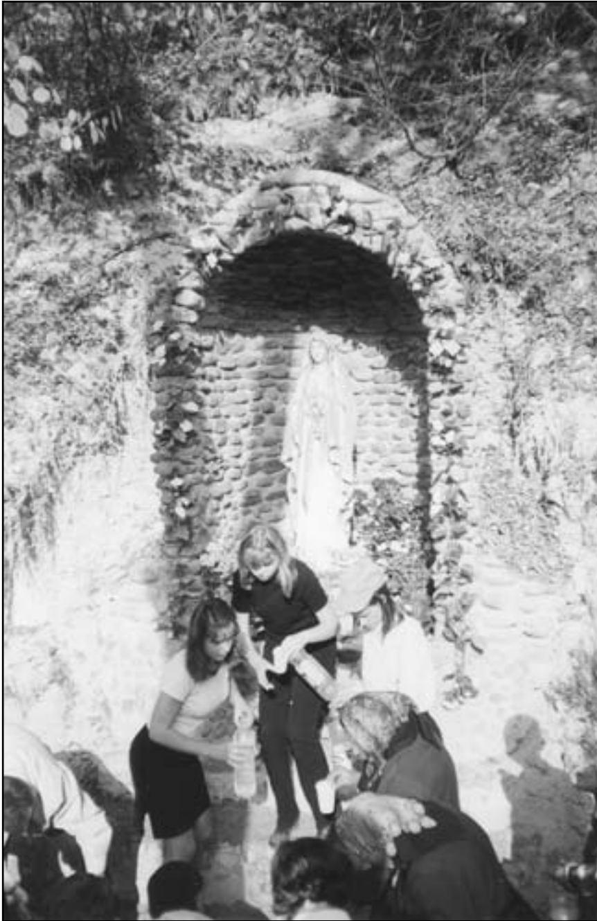
Біля гроти і джерела Матері Божої у Крилосі (Галицький р-н, Івано-Франківська обл.)

6 лютого 1993 року Богородиця нагадала, що Вона є Посередницею ласк і дарів Божих. Усі вони переходять через Її руки. “Ісус, Мій Син, прагне поширити у світі набоженство до Мого Непорочного Серця. І коли сповниться Його воля, на