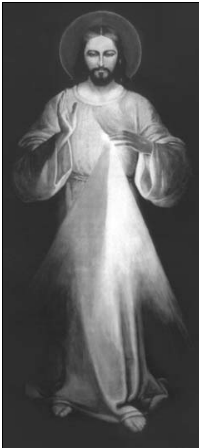
Перший образ Божого Милосердя

– Чому Матінка Божа просить саме тут, у Лішні, молитися до блаженного Миколая Чарнецького? Чому Марія просила тебе повісити образок Миколая Чарнецького у капличці?