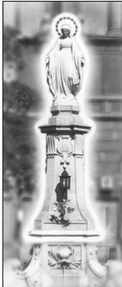
Матір Божя – покровителька Львова

Але навіть, якщо цього разу обійдеться, загроза не зникне, поки світ не вдасть- ся повернути до віри.