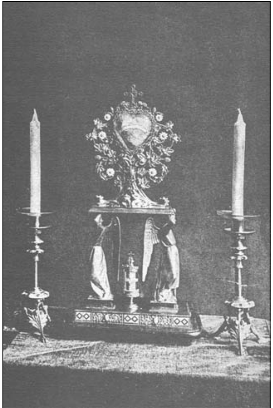
Реліквіарій з мозком св. Маргарити Марії Алякок

життям Церкви. Об'єднання вірних подібне до Тіла Христового. Таємниця ж Його Серця виявляється у Євхаристії, коли Слово Боже читається, проповідується та споживається. Перед тим, як перейти до символіки Тіла, пригадаймо, що, як вважає святий Максим,