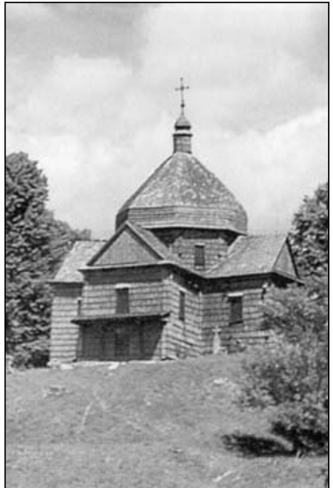
Михайлівська церква XVIII ст. (с. Підгірці, Бродівський р-н, Львівська обл.)

Безмежно вдячна Святому Духу, що просвітив мене, Ісусу Христу, що оновив мене, Матері Божій, що привела мене в цю святу обитель. Господь Ісус дав мені силу змінити те, що можу змінити, і душевний спокій, аби змиритися з тим, чого змінити не можу. На реколекціях я вповні зрозуміла, що заслуги Ран Ісуса можуть стати і моїми заслугами. Одночасно Ісусові Рани, Його Кров і смерть – це самотність моя надія, моє