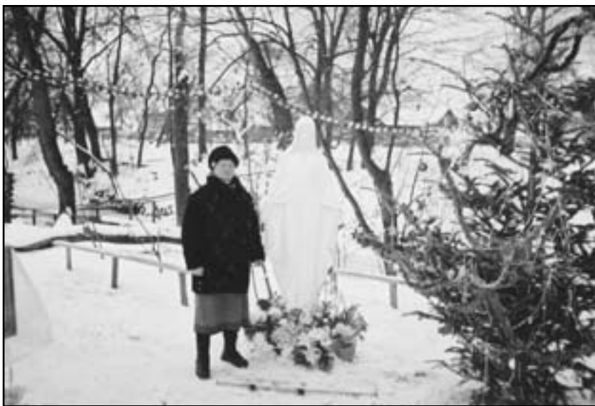
У Лішні на місці об'явлень Матері Божої