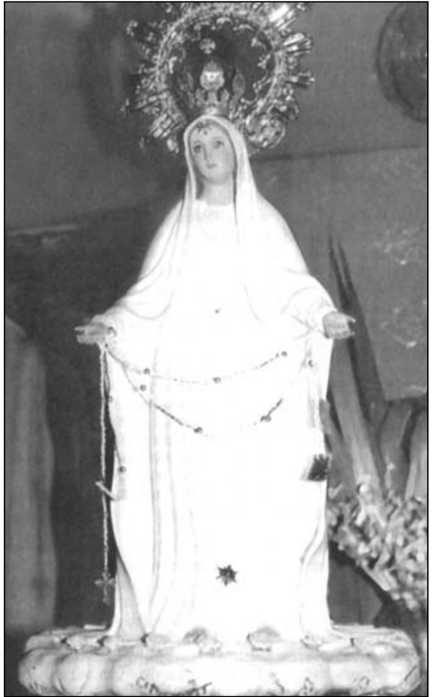
Плачуча фігурка Матері Божої (Ароо, Філіппіни)

Матінка Божа у посланнях, даних Генріку, закликає до молитви, покаяння, винагородження, поправи життя. 9 лютого 1992 року Марія просила, щоб люди неустанно відмовляли вервицю як у храмах, так і в родинях. Богородиця скаржилася на занедбання цієї практики й незнання молитви на вервиці в середовищі дітей та молоді. Молодь у сучасному світі перебуває в великій небезпеці, бо не ходить на Служби Божі, не приступає до сповіді та св. Причастя. Усе це через занедбання релігійного виховання і брак доброго прикладу зі сторони родичів. Тому брат Генрік, виконуючи прохання Матінки Божої, організовує для вірних вечерники молитви: в родинях,