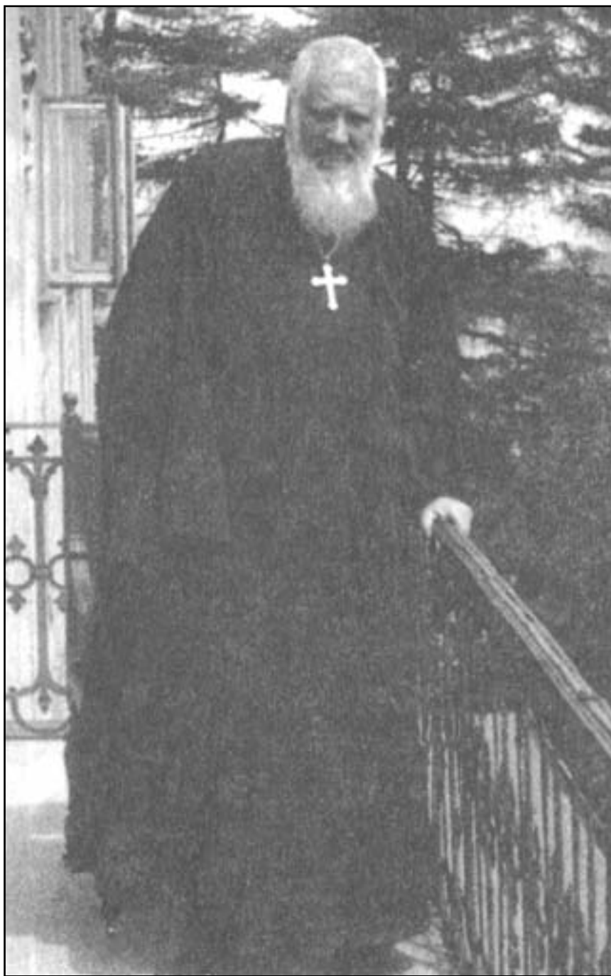
Митрополит Андрей Шептицький на балконі Національного музею у Львові. 1930 р.

2004-ий рік проголошений Вселенською Церквою роком Пресвятої Діви Марії. Для України ж — це рік знаменних ювілеїв, адже у ньому виповнюється сто років від дня смерті матері Митрополита Андрея Шептицького — графині Софії з роду Фредро (17. 04. 1904), яка похована в родинній каплиці у с. Прилбичі, 20 років від дня смерті Патріарха Йосифа Сліпого (7. 09. 1984) і 60 років від дня смерті Митрополита Андрея Шептицького (1. 11. 1944). З цієї нагоди УГКЦ проголосила 2004-ий рік роком безперервних молитов за прославу Слуг Божих Андрея Шептицького і Патріарха Йосифа Сліпого. Беатифікаційний процес Слуги Божого Митрополита Андрея Шептицького розпочався 1958 р. у Римі і триває вже 45 років. Тому Глава УГКЦ Блаженніший Любомир Кардинал Гузар на своїй проповіді в архикатедральному соборі св. Юра у Львові наголосив на необхідності наших молитов за прославу Слуги Божого Андрея. Зупинився і на постаті Патріарха Йосифа та інших подвижниках, котрі спочивають у крипті. Сама ж Божественна Літургія, відслужена у храмі та приурочена 103-ій річниці інсталяції Митрополита Андрея Шептицького на Галицький митрополичий престол у Львові, згуртувала навколо його постаті, світоча духа, численних гостей. Ними були єпископи різних єпархій УГКЦ, і настоятелі Чинів та монастирів, ректори духовних семінарій, паломники з Тернополя й Золочева, діти зі львівських шкіл разом із своїми учителями. А поряд з ними — шанувальники Ми-