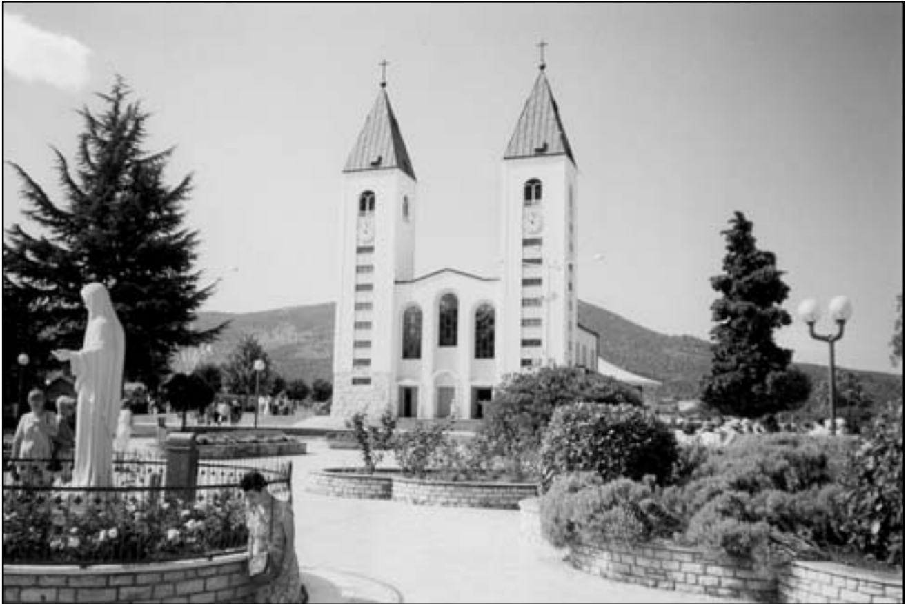
Біля Матері Божої у Меджугор'є