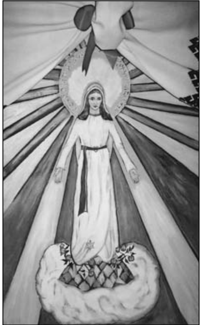
Образ Божої Матері, Богородиці – Ковчезу спасіння в Лішні (мал. Юлії)