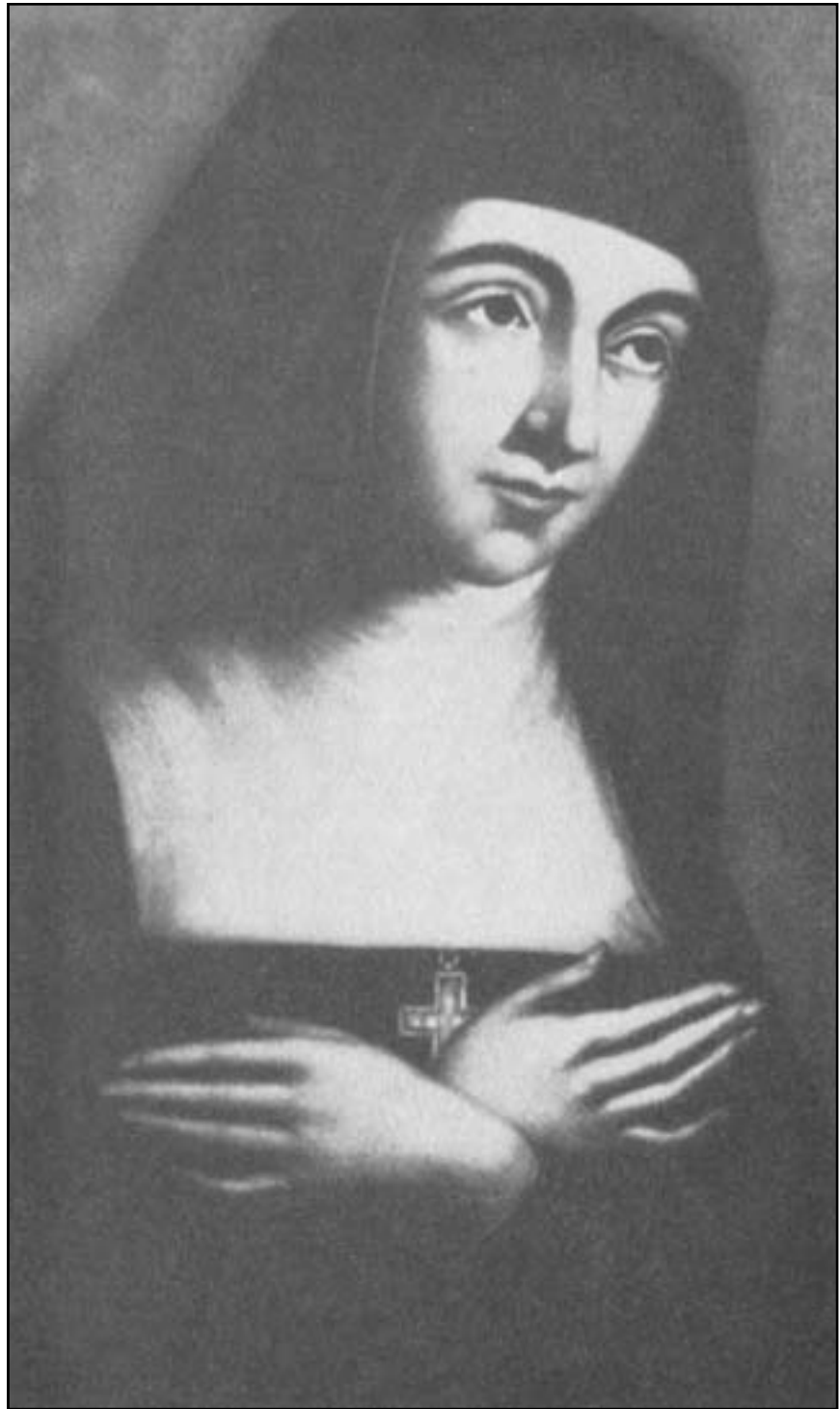
Свята Маргарита Марія Алякок (1647–1690 рр.)

Таким чином, серце є центром поєднання всіх проявів людської істоти. Як вияв тілес-