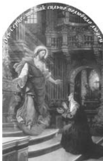
Об'явлення Ісусового Серця с. Маргариті Марії Алякок 1673 року

Його ім'я. Вестимемо мову про “молитву серця”, тому що серце, як пише Святе Письмо, є місцем об'єднання в ціле людських здібностей, найпотаємнішим органом особи, її сутністю. І саме там, у таємному