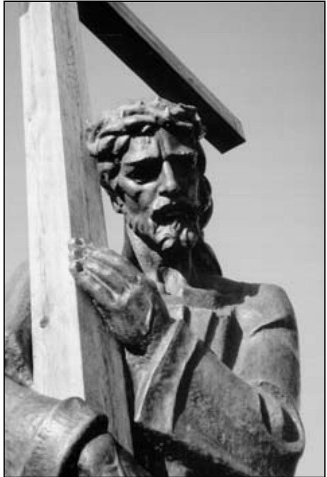
Пам'ятник Спасителів у Страдчі. Фрагмент (скульптор Юліан Савко)

Зранку, коли почало сходити сонце, всі побігли на нього дивитися. Воно спочатку було далеко в небі. Потім почало наближатися. Довкола нього вигравало кольорове проміння, яке вібрало до середини: сонце наче поглинало його. Коли зникли промені, почали вилітати великі червоні й рожеві серця, які розходилися у різні сторони або падали на землю. Одне, саме більше, червоне серце утворилося довкола небесного світла. Потім я побачила на небі три сонця, які поступово зійшлися в одне. Від того одного пішло проміння хрестом. На цій, Богом благословенній землі ще було дві загальні вервиці і дві Служби Божі. Після чого наші радехівські