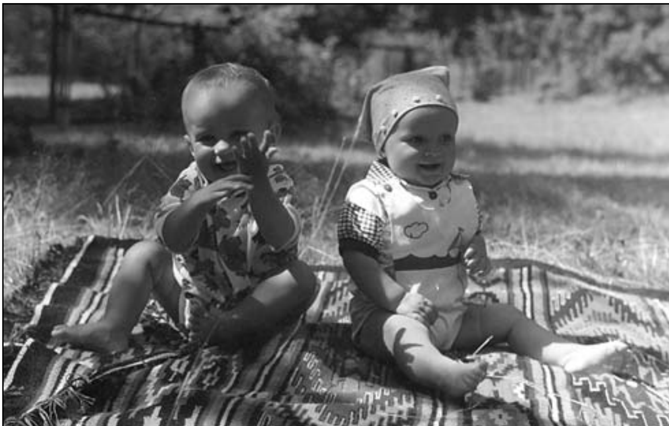
Серія світлин “Діти Галичини”, ХХІ ст.

якусь власну забавку, володіння котрою в інших може викликати заздрість. У дітях батьки повинні вбачати цінний скарб Всемогутнього Бога, призначений до вічного життя. Формування душі дитини згідно з волею вічного Бога належить до найщасливіших завдань і обов’язків батьків та педагогів.