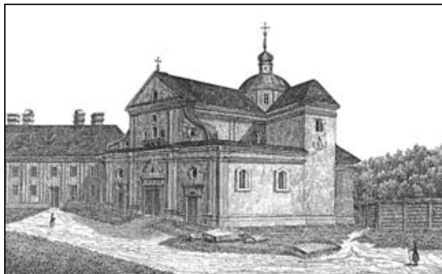
Церква св. Онуфрія в Підгірцях

– Образ Пречистої Діви довготривалий час “сльозами ревними плакав” (від 21 квітня до 24 вересня 1692 року).