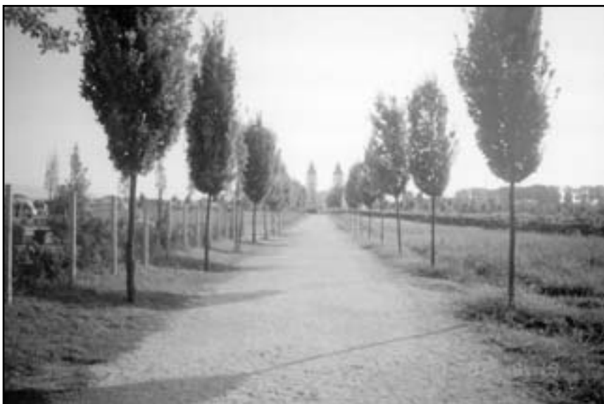
Дорога до храму св. Якова в Меджугор'є

Також і нині Мати Марія закликає Своїх дітей прислухатися, почути Її слова. Вона не кличе ні завтра, ні вчора, а сьогодні, в цей найважливіший момент у нашому житті. Ми не можемо зупинити життя та час. Час наближається до свого кінця, це значить – до свого нового початку. Марія хотіла б, щоб ми почали готуватися до нашої вічності. Від нашого сьогоднішнього рішення залежать і наше майбутнє, і наша вічність.