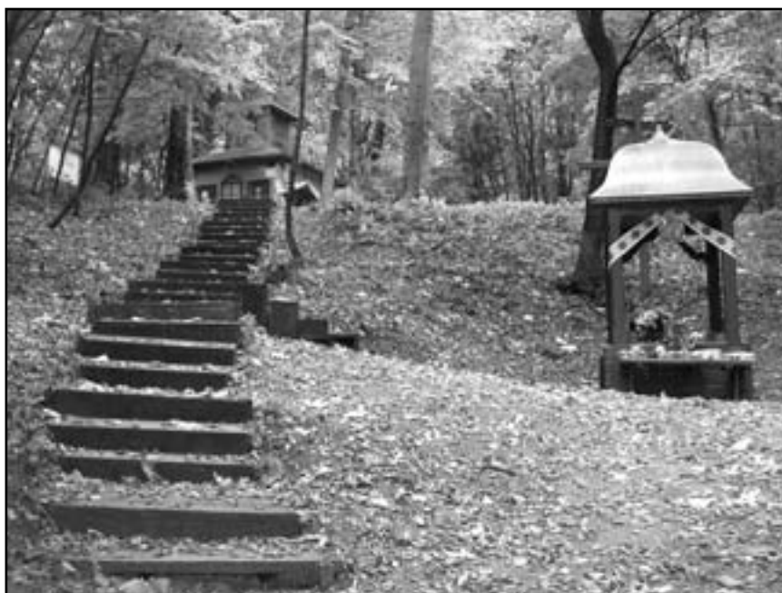
На Святій горі біля кринички

йшли ми вранці, стали коло криниці. Людей було вже багато. І тут дуже мені закортіло підняти подовгастого каменя, що лежав коло самої криниці. Підняла. На тій стороні, якою він лежав на землі, я побачила відбиток стопи, долоні і півобличчя у профіль. Тут почали до мене бігти люди. Якою ж я була наївною! Думала, що такої святині не смію забирати додому, тому взяла й віднесла до гроти й поклала з правого боку. А часи були комуністичні, багато злих людей приходило, в сорок дев'ятому році пробували навіть підірвати ту гроту. Отак мій камінець безслідно й щез. Дуже шкодую, але вже ніц не вдію. А листя з клена, то люди моментально порозбирали. Дуже багато різних образів на них дивом повимальовувалися. Останній листок я якійсь польці віддала. Під милість Божу благала. Я собі тоді подумала: для мене то все залишилося в моїм серці до смерті, а про те,