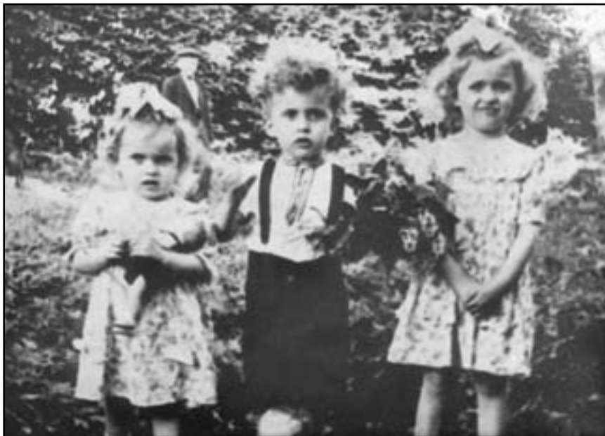
Серія світлин "Діти Галичини", 50-ті роки XX ст.

ніколи не був без гріха, колись людина також була зла..."