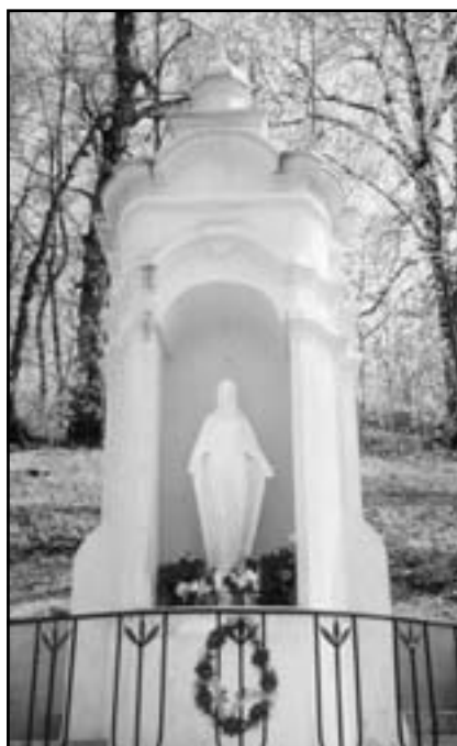
Капличка Матері Божої на Високому замку у Львові

магіями, чародійством, ворожінням, отожд безпосередньо служить таким людям. З благословення мого духівника отця Порфирія (Павла Чучмана), монаха Чину Отців Студитів, котрий служив у Яремчі, я проводив молитви проти чародійства, ворожби, злих духів. Перед смертю о. Порфирій поблагословив мене і сказав: “Я