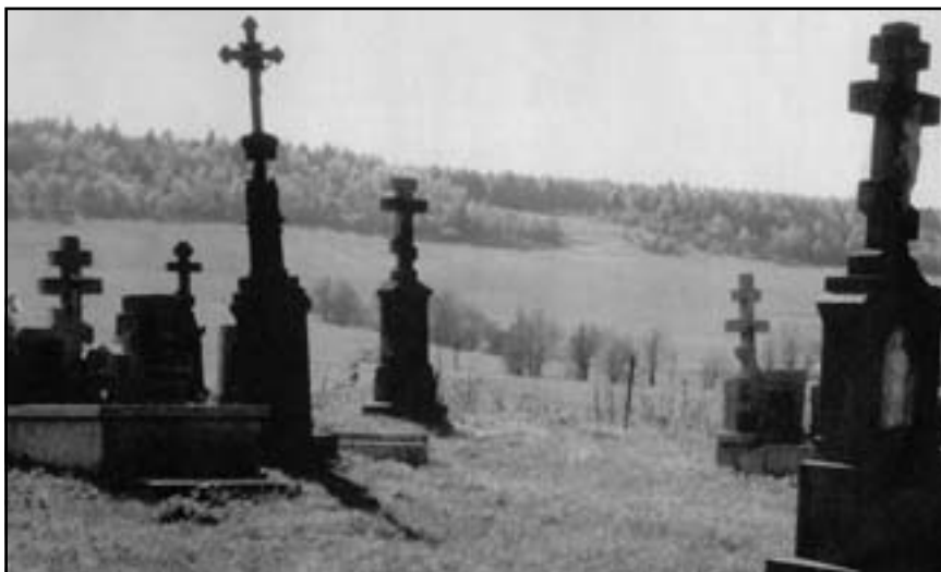
Український цвинтар на Лемківщині