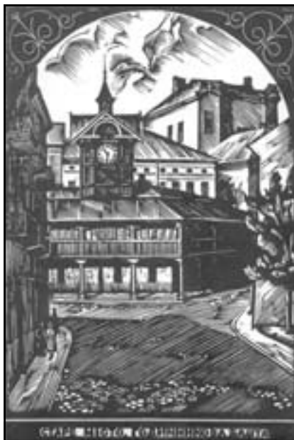
Ліногравюра, м. Чортків (художник Степан Шевчук)

Не з шістнадцяти років потрібно вчити про можливу загрозу для життя, і не тільки земного. Ще з утроби потрібно виховувати, ще до зачаття слід закласти інформацію, яка передається генетично. Чому ховаємо правду за дверима, подаючи до столу перебрані страви? Можливо, когось не лякає смерть, то злякає вічне прокляття у пеклі, де не існує любові, де Бог далекий і недосяжний, де немає надії, бо вона померла разом з тілом. Не в школі, а в сім'ї потрібно виховувати. В здоровій християнській сім'ї, де мораллю служить закон Божий, де найбільша благодать – бути з Богом. Чому даємо дитині у руки зброю, а потім кажемо, що винен час, суспільство, Бог?