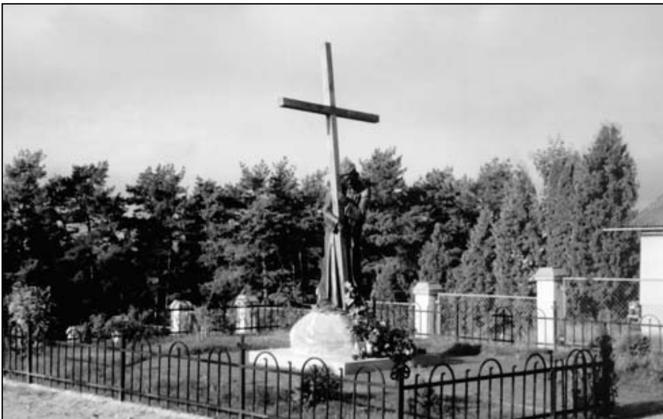
Пам'ятник Спасителю у Страдчі (скульптор Юліан Савко)