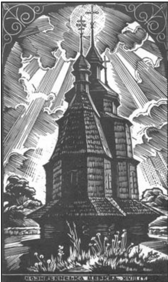
Ліногравюра, м. Чортків (художник Степан Шевчук)

Коли батько і матір, перебуваючи ще у вільному стані, перебралися зі села до міста, розірвали всякий зв'язок з Церквою і прилучилися до антицерковних кіл. Мама ніколи мене не вчила, як потрібно посправжньому молитися, бо завжди була зайнята щоденними клопатами, хоча наша матеріальна ситуація була не найгіршою. Такі слова, як-от: "молитися", "Служба Бога", "свячена вода", "церква" вимовляю з найбільшою огидою і відразою. Обриду будять у мене люди, які "ходять до церкви". Зрештою, бриджуся всім: і людьми, і речами, бо усе це збільшує нашу муку. Після смерті кожний спогад про те, що колись на землі переживалося і бачилося, подібний до гострого полум'я... Усі спогади показують нам одночасно погорджені через нас ласки. Це – найжахливіша мука... Не їмо, не п'ємо, не ходимо на ногах, душа обтяжена наче якимись кайданами, плач і скрегіт зубів... погляд,