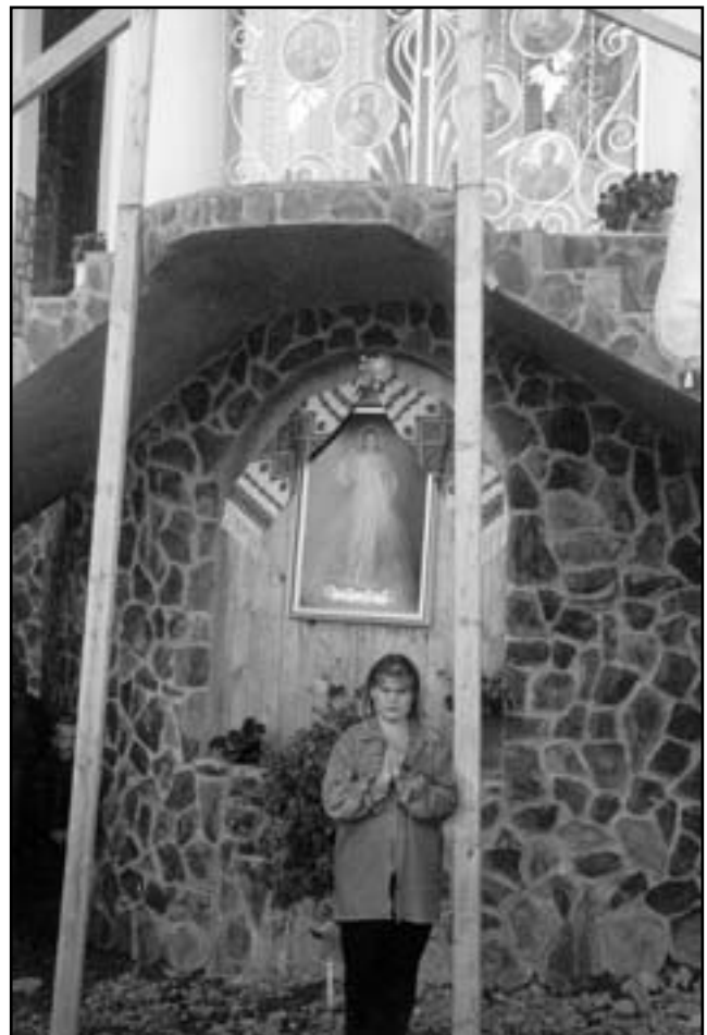
Біля каплички в урочищі “Під Джубликом”

Потім почали відбуватися дивовижні речі. Сонячні промені стали переливатися різними кольорами, яких навіть у природі немає. У цих променях почали з'являтися... постаті, які швидко зникали. Я, наприклад, без перерви дивилася на небесне світло. Спочатку побачила Діву Марію і маленького Ісуса. Вони йшли, тримаючись за руки. Було видно, що Ісус промовляв до Марії. Вона кивала головою на знак згоди. Потім я побачила маленького ангелика, такого, як малюють у церквах. Він весело забавлявся. Я вже й плакала, й смілася одночасно. Раптом цей ангелик впав на коліна і, здійнявши руки вгору, поклонився. Після цього ніби розчинився у сонці. З'явилася Пресвята Родина: Ісус, Марія та Йосиф. Ісус тримав у Своїх ручках галузку. Цього разу Він щось говорив до Йосифа, який теж кивав головою на знак згоди. Було ледь