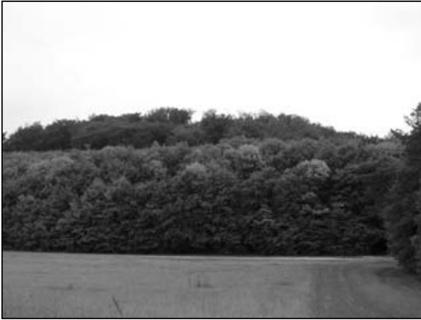
Загальний вигляд на Святу гору

що хтось за цим колись через багато літ буде питати – я й не думала. Малі ще мої літа були тоді. Я тішилася тим, що в мене є Свята гора...”