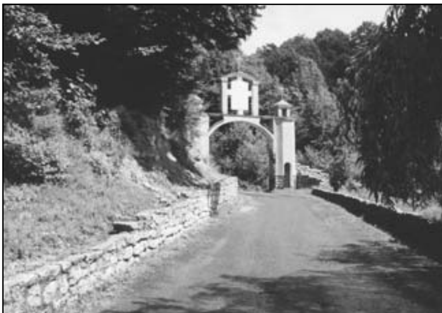
Дорога з монастиря

Можна ствердно сказати, що її автором був добре відомий на той час поет-василіянин, проповідник Юліан Добриловський, який узяв за основу пісенний твір видатного василіанського поета-пісняря Дмитра Левковського.