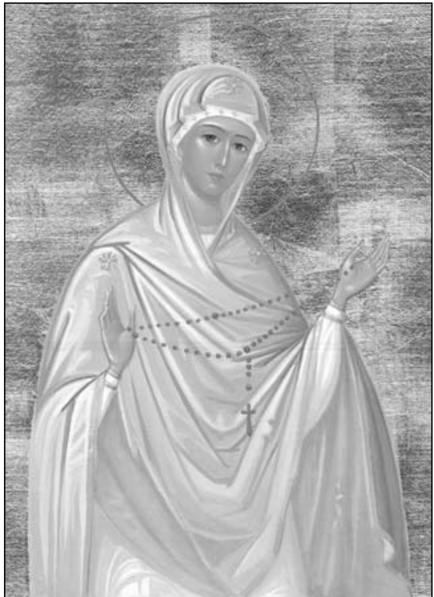
Ікона Матері Божої з вервичкою в руках (художник Юрій Дрозд)

рається закликам Неба і зневажає Бога, валяючись у багні гріха... Справедливість Божа почне сповнюватися. На цілій землі відбуватимуться страшні революції, позаяк люди, як за часів потопу, покинули дороги Бога. Їх опанував злий дух... Збезчещене гріхом людство буде облите власною кров’ю й уражене хворобами,