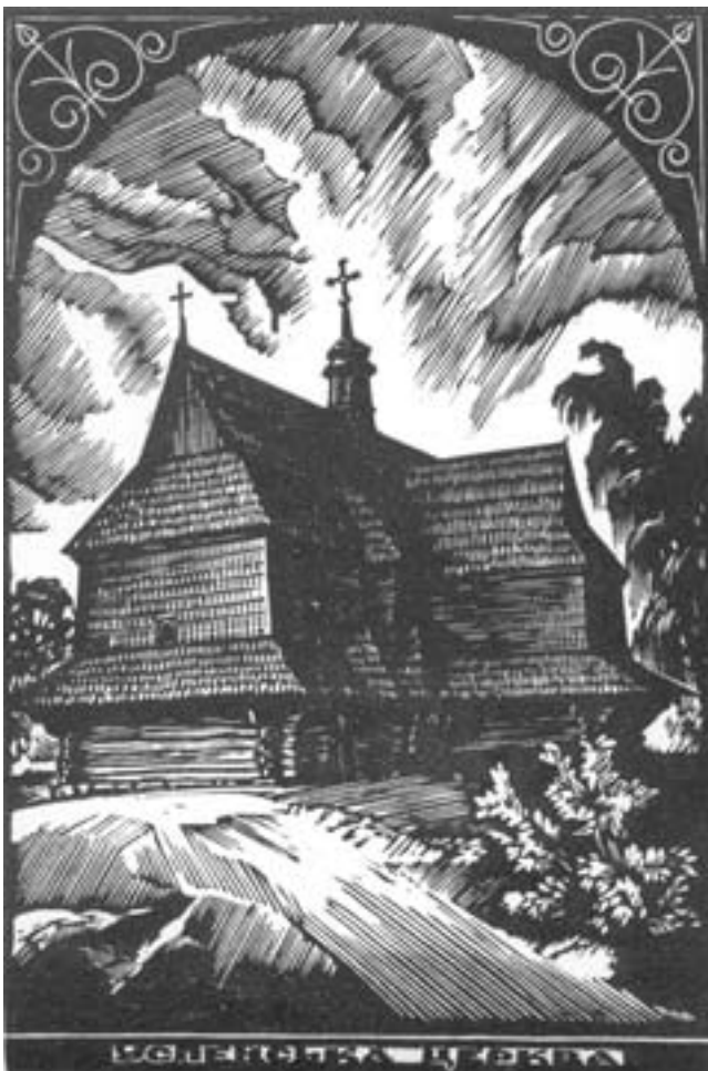
Ліногравюра (художник Степан Шевчук)

Св. Павло підтвердив принцип рівності жінки і чоловіка, опираючи його не лише на природі людини, але й також на Христові (мова йде про гідність синівства Божого, отриманого під час св. Хрещення). Необхідно, однак, зауважити, що підтвердження єдності не усуває різниці. Юдей чи грек заховують свої характерні риси, оскільки вони стосуються також чоловіків і жінок. Рівність охрещених – це ще не ідентичність, ані вищість одних над іншими.