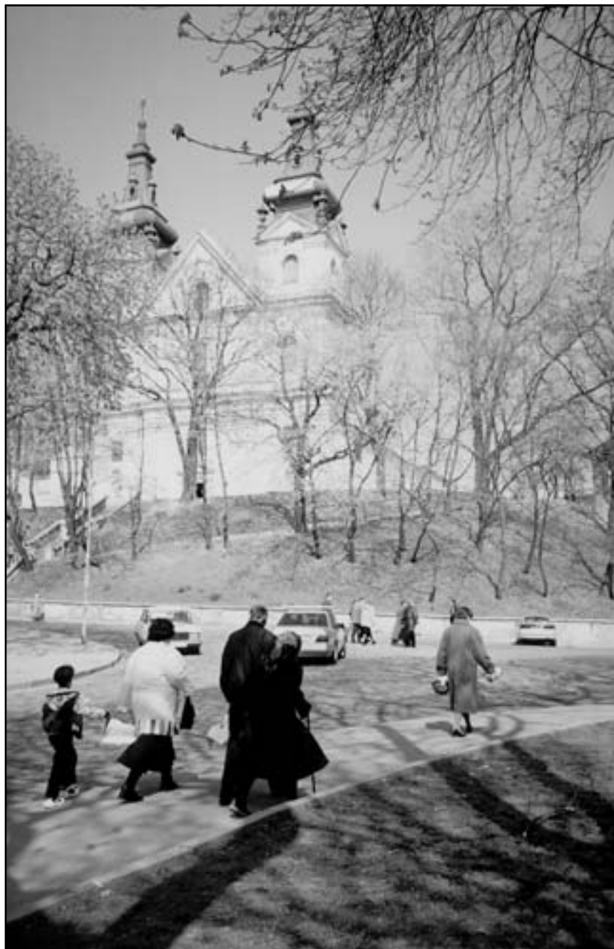
По дорозі до Михайлівської церкви у м. Львові

Матір і дитя! Пригляньмося до захоплюючого образу Мадонни: Пресвята Діва Мати тримає на