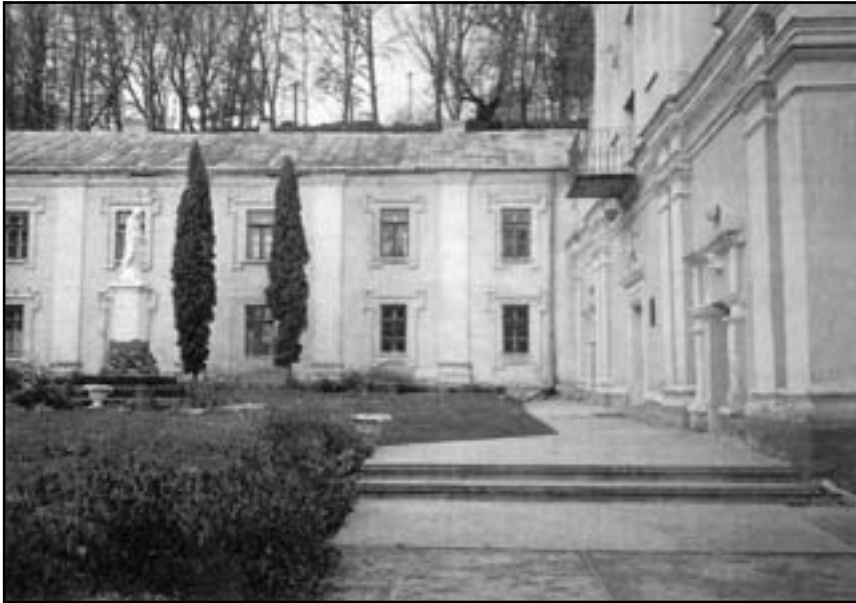
Внутрішній двір монастиря в Підгірцях

хвилину завдяки вірі переживаю правдиву свободу. А через це віддаю вповні Ісусові до рук своє серце, відчуття, свій розум, свою волю, свої руки, ноги, цілого себе. Тепер насправді живе в мені Христос!