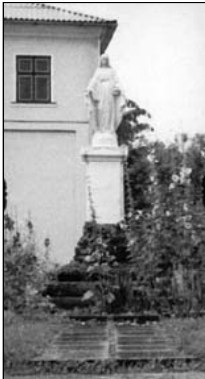
Фігура Матінки Божої Непорочної Зачаття на подвір'ї монастиря в Підгірцях

зелені, справляючи враження райського куточка. Якщо королівський замок вразив нас розшарпаною могутністю і всепоглинаючою минучістю, то монастир навпаки: незнищеною силою і мовчазною вічністю. Він відродився. Він не вмирає, як замок. І небо тут було якимсь ближчим. Воно ніби всотувало в себе оту