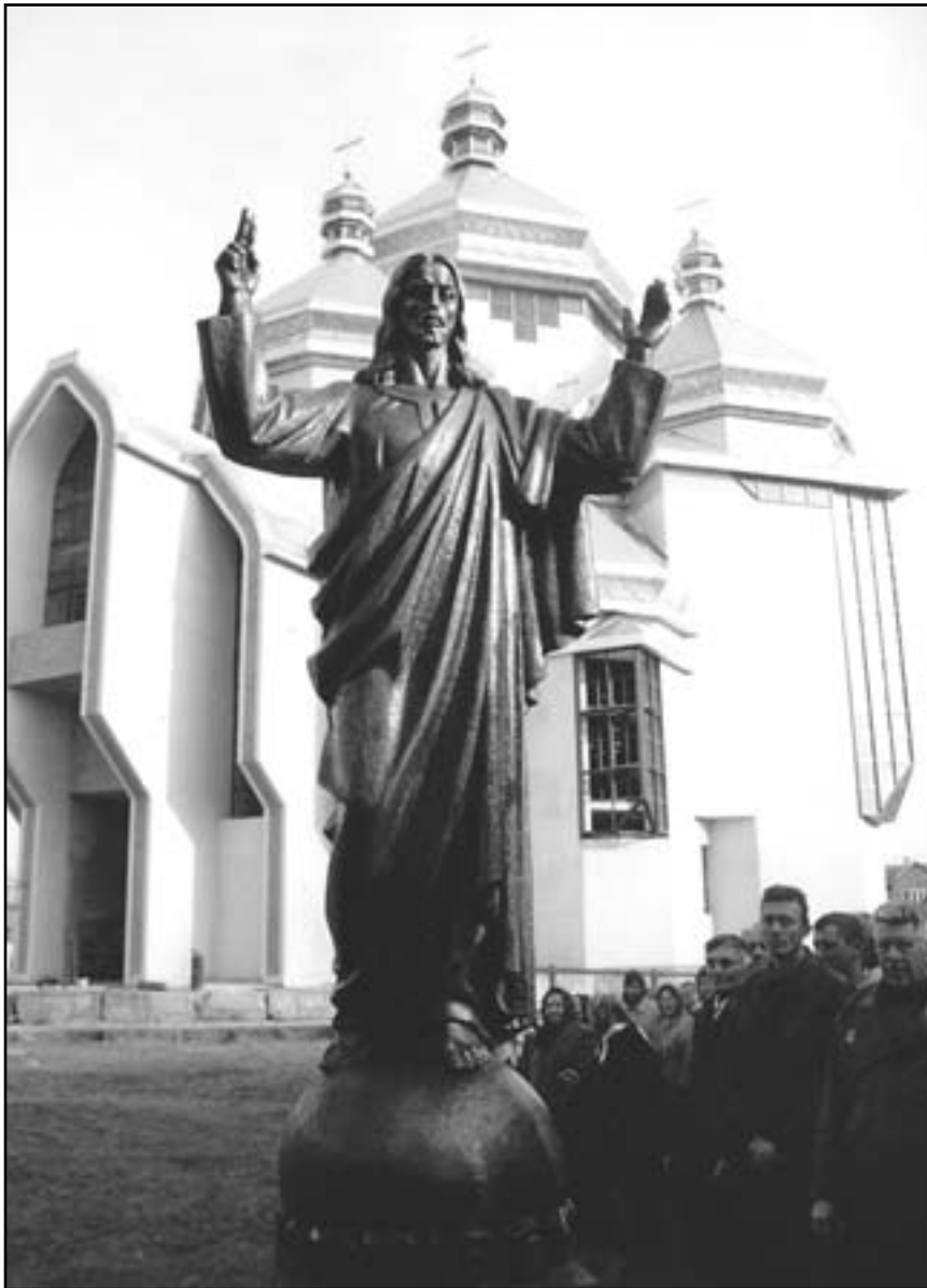
Пам'ятник Ісусові Христу в Радехові (скульптор Ярослав Лоза)

які дуже криваво помстились йому: двох його синів і п'ятьох онуків повісили на шибениці, поставленій на високій горі, а що найгірше – не дозволили похоронити трупи, що в той час було найбільшою карою!