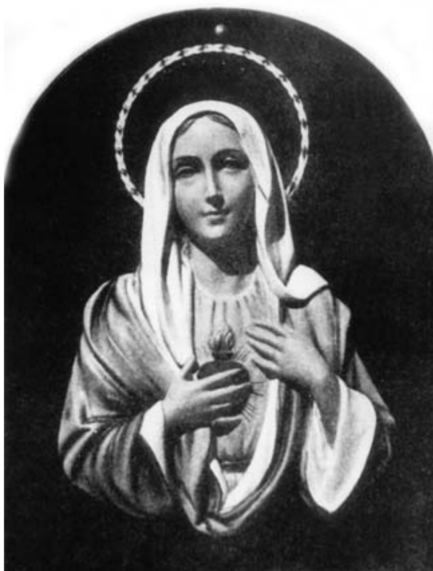
Сльози Марії в Сиракузах (Сіцилія)

З 27 березня 1966 р. 35-ти річний Енцо Алоччі, батько семи дітей, переживав часті візії Матінки