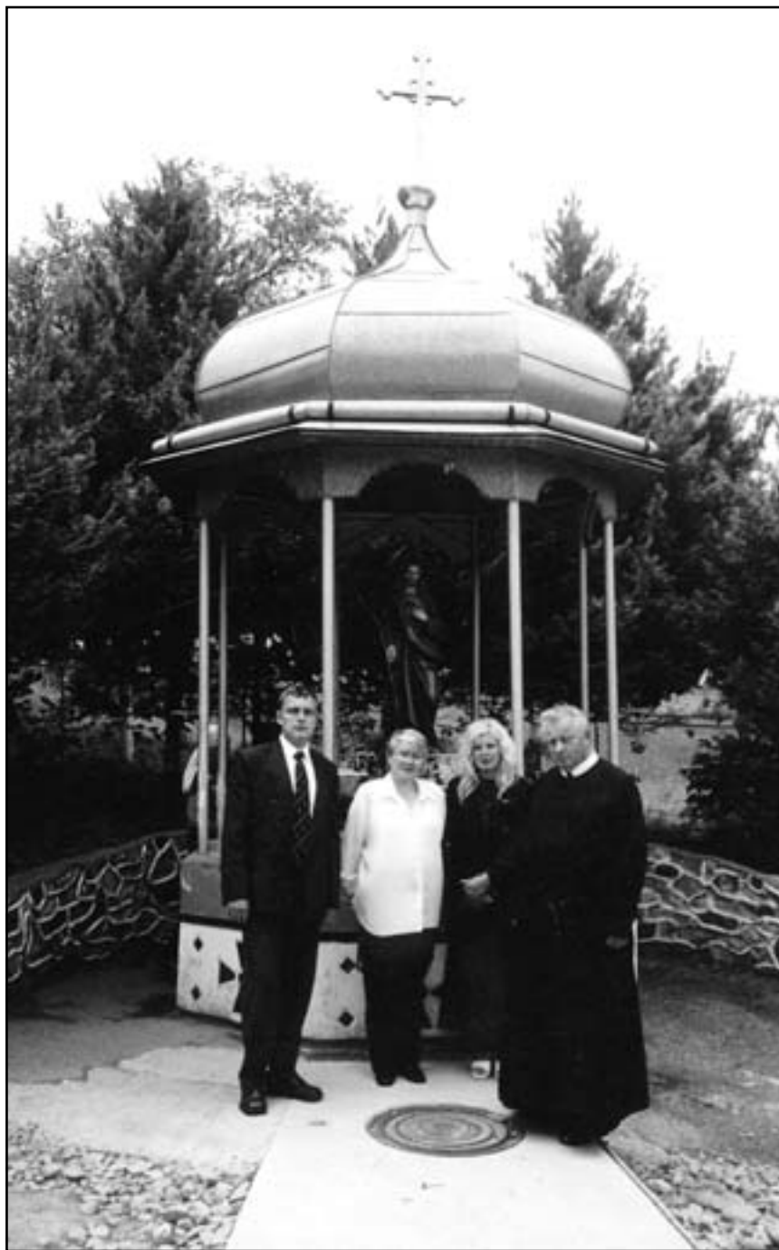
Біля каплички Ісусового Серця в Гошеві

але й моральних. Наголошую на цьому, особливо для дівчат, які не з особистих причин не могли вийти заміж, вони також повинні виконувати покликання жінки, як матері. Бо жертвність, властива