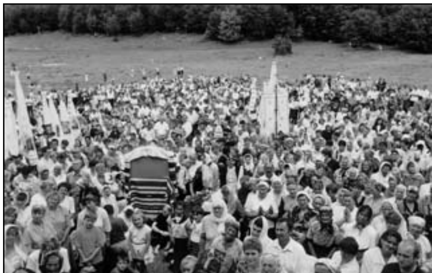
На святі у Погоні

1996 р. я віднайшов ще одну ікону Матінки Божої в с. Дорі поблизу міста Яремча (копію тієї, що в Тисмениці). У травні цього ж року ікону було урочисто перенесено до Погоні. Цей похід