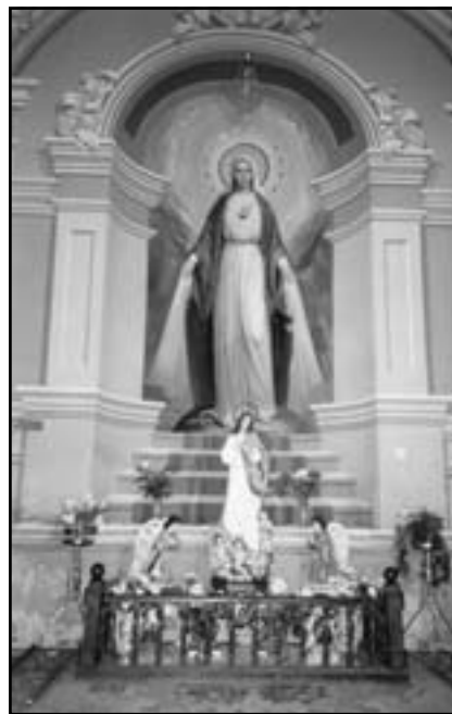
Бічний вітвар Матінки Божої у Гошеві

У неділю 8 січня 1871 р. о. Герман був у Берліні і робив закупи для в'язнів, дуже втомився, жалівся на горло, лице його було бліде, але погідне. У п'ятницю 13 січня він захворів.