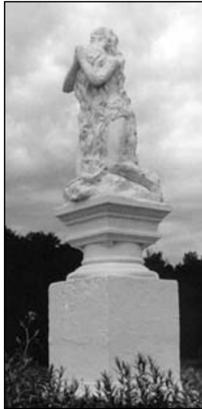
Пам'ятник св. Онуфрію в Підгірцях

піднявши подружжя на таку ступінь чистоти, що був у Божих думках, коли Він створював прародичів. І коли потребував, щоб Марія стала Матір'ю – Пречиста цілком довірилася Йому, хоч не відала, як це станеться. Марія сказала Творцеві