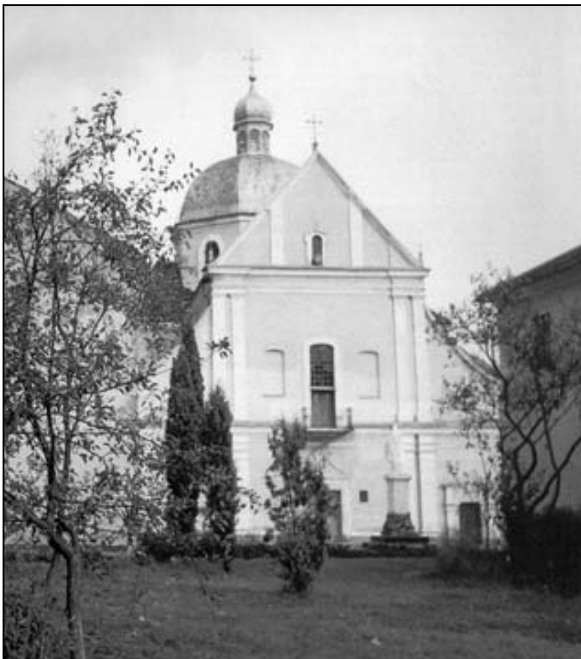
Церква св. Онуфрія в Підгірцях

приходить терпіння, випробування, автоматично бунтую). Я є тим, хто шукає насолоди, а це мене відвертає від шукання правди і жертвування себе ближнім у любові. Господи Боже, я не виконую Твою першу заповідь – не люблю Тебе, Господи, цілим серцем, цілою душею і всіма силами, і так само не люблю свого ближнього, як самого себе (Мт. 12, 2). Усвідомлюю собі годину своєї смерті, Божий суд: “Нічого нема бо захованого, щоб не відкрилося” (Лк. 12, 2), що гріх – реальність, “бо заплата за гріх – смерть” (Рм. 6, 23) – дочасна та вічна!