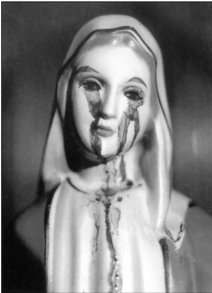
Криваві сльози Марії в Наю (Корея), 26 листопада 1989 року

шість із них дуже добре усвідомлювала, що причиною такого плачу і сліз Марії є наші гріхи, життя без Бога. Марія на Голготі стала нашою духовною Матір'ю і любить усіх нас материнською любов'ю. Вона прагне нашого щастя. Отець Небесний створив нас із нескінченної Своєї любові та призначив до життя вічного, вчинив усе, щоб люди були з Ним щасливі у вічності. Після трагедії первородного гріха Отець Небесний через Свого Єдинородного Сина, Спасителя людства, повертає людям можливість осягнення вічного і щасливого життя з Ним. Марія в історії спасіння людства займає особливе місце. Як духовна Матір відкупленого людства, перебуває в глибокій тривозі за долю Своїх дітей, бо вони, як істоти розумні та вільні, не завжди добре використовують дар волі згідно з волею Отця Небесного. Дуже часто люди устами висловлюють пошук своєму Господу, однак наперекір Його волі зневажають Його своїми гріхами, ранять Його любов, наносять, таким чином, глибокі рани Серцям Ісуса і Марії. Кожна велика любов, поранена і погорджена, болить дошкульно. Із-за цього наша Небесна Матінка Марія плаче, бо Її діти дуже часто недооцінюють любов Отця Небесного, а також Її любов, легковажать і погорджують нею. Тому Марія виражає Свій біль і духовні терпіння сльозами, прагнучи промовити до нас, зворушити наше сумління і затверділі серця. А що люди? Вони, обдурені та зачаровані злом, котре прибирає вигляд видимого добра, не завжди задумуються над своїм негідним життям і його наслід-