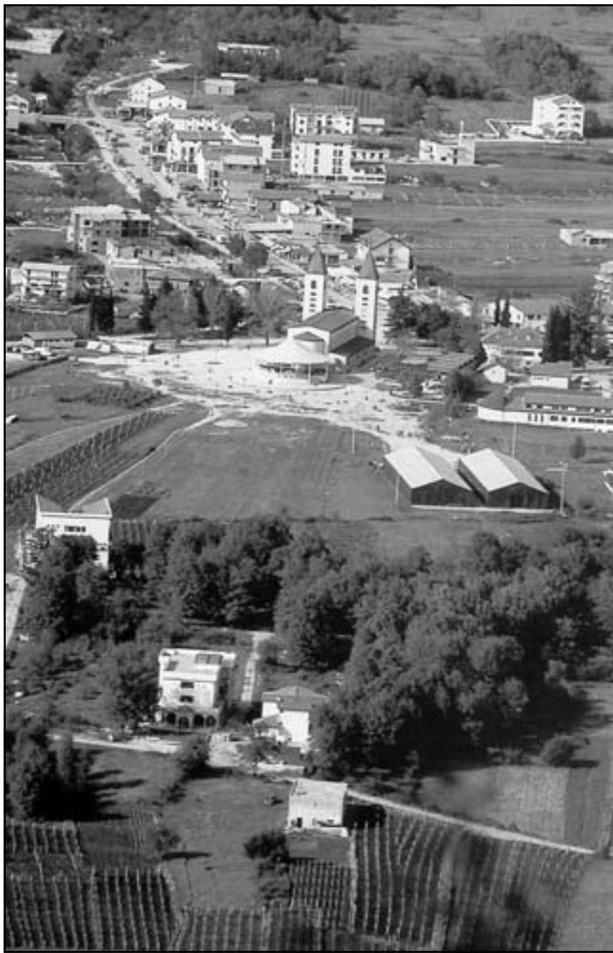
Меджугор’є – місце об’яв Матінки Божої, вверху – церква св. Якова

У Своїх посланнях Пречиста Діва Марія часто згадує слова “сьогодні”, “зараз”, “цей момент”. Вона б хотіла нам сказати, що “вчора” минуло і що “завтра” ще не настало; є тільки сьогодні, зараз. Я можу зараз вибрати Бога та молитву, можу зараз стати віруючим або невіруючим. Скільки людей живуть “розп’ятими” між учора та завтра і не живуть тепер, отож вони ніколи не є при собі, та у цей час, що його дарує Бог. Більша частина Її послань починається словами: “Також і нині Я закликаю вас”. Нічого не змінилося у силі, у любові та в очікуванні закликів. Марія залишається такою самою, бо Вона більше не потребує жодної зміни. Запитаймо себе, наскільки ми змінилися, або чи ми залишилися такі самі. Бо той, хто не йде вперед по шляху віри, той автоматично йде назад. Духовне життя – це не зручність і приємність, а безперервна боротьба на життєвому шляху. Так, як говорить страждаючий Йов: “Чи ж то життя людини на землі не служ-