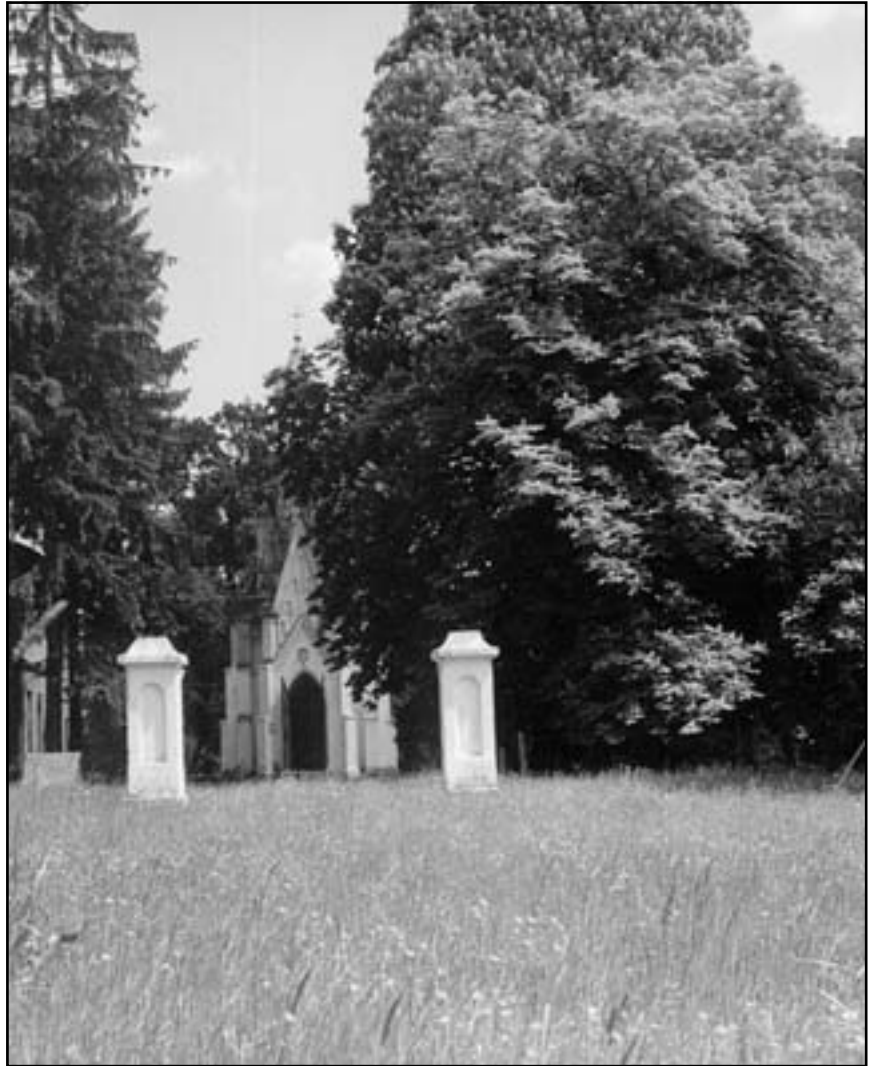
Капличка в Кохавині на чудотворному місці (Жидачівський р-н Львівська обл.)

Слід звернути увагу на те, що за своїм характером цей твір є діаметрально протилежний тим бульварним романам, які читають перед сном, тому захоплює до самостійного аналізу, допомагає зміцнити наш дух і волю, наше бажання жити у злагоді зі своєю совістю. Гадаю, що така література є актуальною, особливо тепер, у ХХІ сторіччі, коли ми досягли великих успіхів у розвитку науки і техніки, побували на інших планетах, але