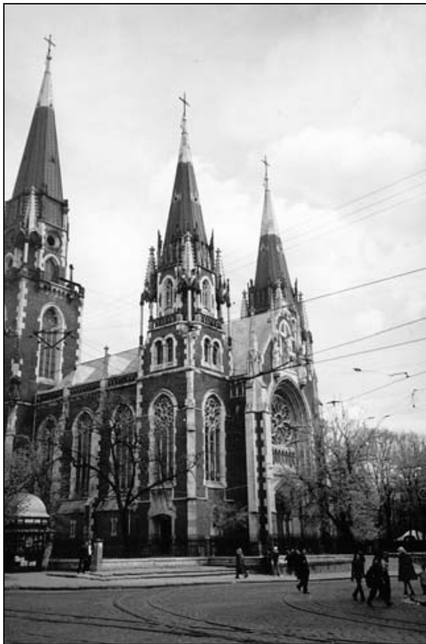
Церква св. Ольги та св. Єлизавети у Львові

лений Хрест улюбленого Ісуса, – пише він у листі, – немає нічого кращого, ніж тішитися, що ці терпіння можу перенести з любові до Ісуса. Так солодко віддатися зовсім на Його волю. Здається мені, що, якби діткнувшись одного волоска з голови, я міг би вилікуватися, не вчинив би цього доти, доки Ісус хотів би, щоб я був хворий”. Отець Герман,