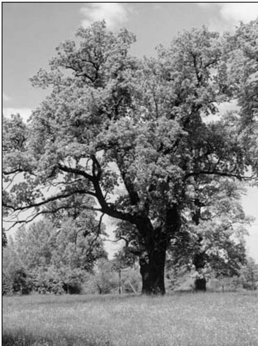
Правіковий дуб в Кохавині на чудотворному місці

Благодать вам и мир от Господа нашего Иисуса Христа. Давно собирався написать письмо, видя плодотворный ваш труд во славу Господа нашего Иисуса