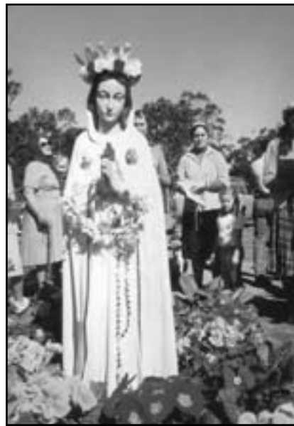
Фігура Містичної Троянди

“Ворожість між людьми стає щораз більшою, а вони не навертаються вже більше до Бога. Прийде час, як тобі про це говорила, що обличчя багатьох людей буде подібним до страхотливих чудовиськ, котрі мордують без милосердя. Повітря стане заразливим, земля буде покрита трупами. Хвороби і нещастя спадуть на землю. Голод і безробіття огорнуть