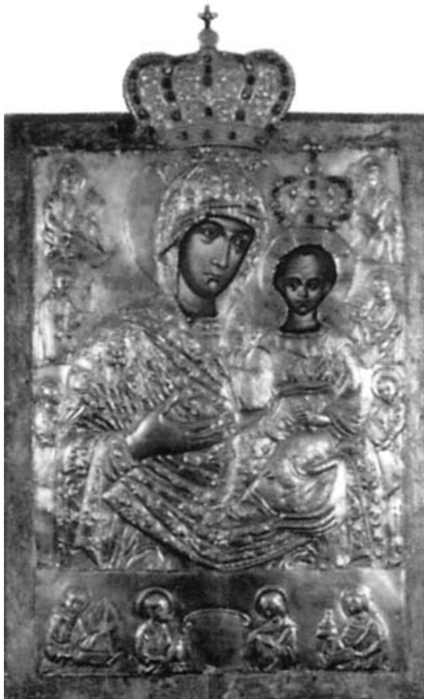
Підгорецька чудотворна ікона Матінки Божої