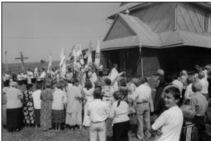
На святі у Погоні

тривав біля трьох тижнів. Під звуки трембіт ікону Матінки Божої урочисто внесли у храм. З цих пір у нашій церкві остання неділя травня святкується як день почитання Матінки Божої в Погоні. Ці обидві ікони до 1815 р. були прикрашені срібними ризами, але коли уряд тодішньої Австро-Угорщини видав наказ про конфіскацію церковних дорогоцінностей, то їх передали у державну скарбницю.