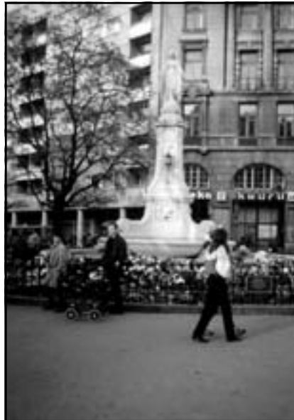
Біля пам'ятника Матінки Божої у Львові

Недалеко від Єрусалиму, у Витанії, жила щаслива родина, яка складалася з Марти, Марії і Лазаря. Христос Господь особливою лю-