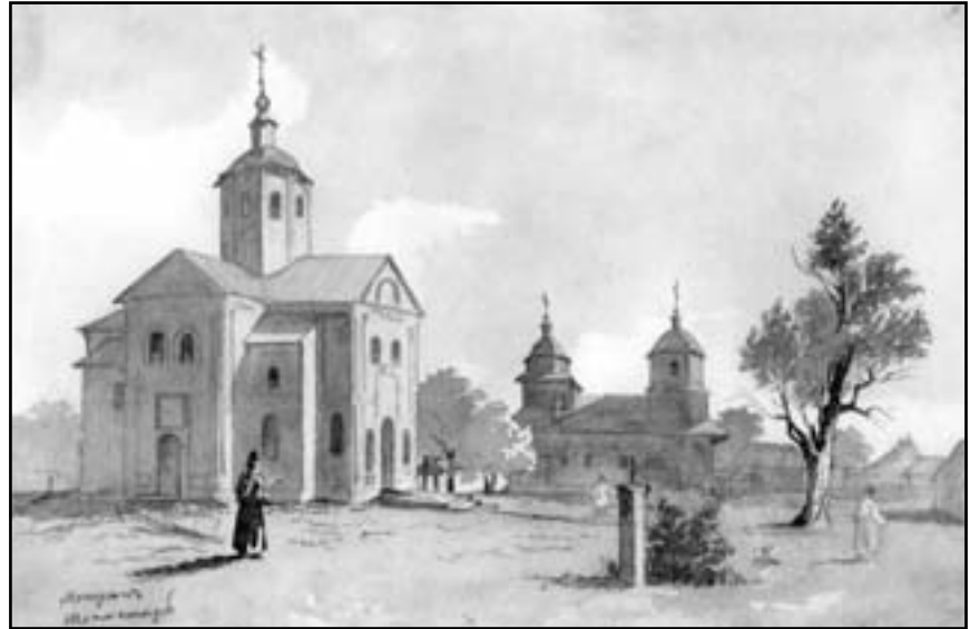
Тарас Шевченко. Мотрин монастир (1845)

Слово “Церква” (лат. ecclesia) означає скликане зібрання. Святковий день для християн – це найважливіший час, а храм – місце, де вони переживають анамнезу (спомин) Господа як справжню зустріч з Христом, присутність таємниці Його життя, смерті та Воскресіння. У 17 розділі Євангелії св. Йоана передано цю головну суть християнства: “Щоб усі були одно, як Ти, Отче, в Мені, а Я в Тобі, і щоб і вони були в Нас об’єднані” (17, 21). Християнин – це той, хто перебуває в Христі. Для того, щоб звершити працю відродження в серцях людей, Христос дає нам змогу з’єднатися з Ним під час урочистого згрома-