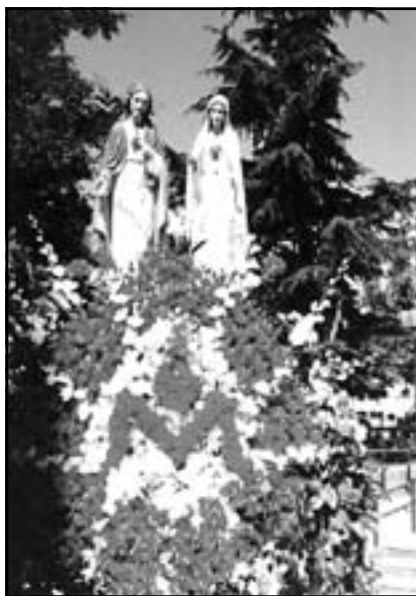
Меджугор'є. Скульптура Двох Найсвятіших Сердець

приходимо через відданість Богові, без зусиль та без напруження. Про це пише нам співець псалмів: “Серце моє, о Господи, не горде, та й очі мої не несуться вгору. Я не женусь також за тим, що велике й дивне для мене. Я втихомирив і заспокоїв мою душу, немов дитятко на руках у матері своєї, немов дитя – душа моя у мене. На-