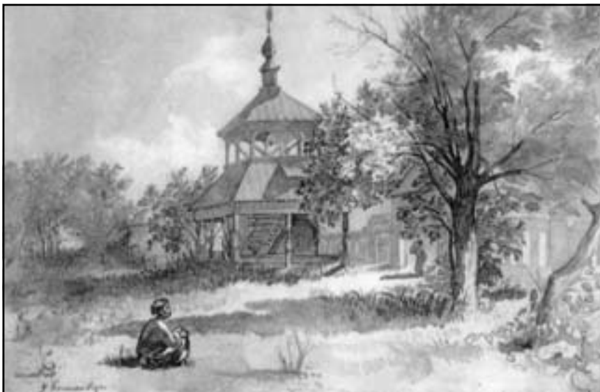
Тарас Шевченко. У Василівці (1845)

У різних ситуаціях священники часто чують зізнання: