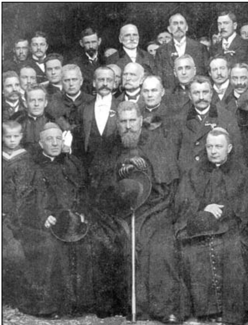
Митрополит Андрей Шептицький. Коломия, 1912 р.

кому посланні “На поміч безробітним і вбогим” виступає із закликом: “Наближається страшна доля бідних людей – зима. Соткам тисяч нещасних, потребуючих помочі, грозить просто смерть від голоду і холоду. Церква, духовенство і вірні мусять в ім’я любові Христа дати їм поміч. Матеріальну, моральну і релігійну поміч. Ніхто не сміє сказати, що з огляду на господарську кризу є це неможливо. Найкращі пам’ятки і діла милосердя зацвітали в часах загального зубожіння і руїни. Поділитися з убогим останнім куском хліба та злишньою одежею,