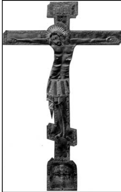
Чудотворний Хрест, перед яким у дитинстві молився св. Йосафат

ласки побачити Найсвятіше Тіло Спасителя і торкнутися до Нього