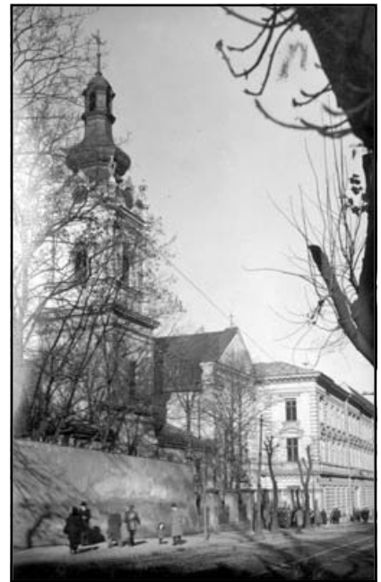
Загальний вигляд Львівської Духовної Семінарії Св. Духа, 1931р.

11 квітня 1945 р. Митрополита Йосипа заарештували, відвізши у Львові до в'язниці по вул. Лонцького. Відразу ж на другий день його відправили до в'язниці на вул. Короленка у Києві. Там, як зрештою і в Москві, Кир Йосип перебував