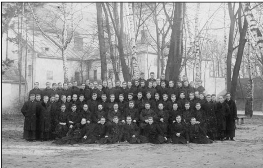
Семінаристи Львівської Духовної Семінарії Св. Духа з ректором о.-д-ом Йосифом Сліпим, 1931р.

на безперервних, часто нічних допитах і таким був обезсиленним від знущань, голоду, що не міг самотужки потрапити на допити до слідчого судді. Його часто тероризували до підписання документів, які не узгоджувалися з сумлінням Владики: до відступництва від віри, до зречення єдності з апостольським престолом. За таку очікувану зраду пропонували Київську Митрополію. Та, однак, недруги у своїх планах щодо Кир Йосипа дуже прорахувалися. Їхні зусилля зламати Митрополита розбивалися, наче човни, потрапляючи на підводні рифи. Тож, тоталітарна система депортувала Владику-в'язня до Новосибірська, а звідти – до Маріїнська