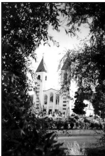
Храм св. Якова в Меджугор’є

лилися. Ісус воскрес, і відтоді Його Руки досягають численних хворих та грішників, яким Він відпускає гріхи. Через Його Руки щоденно на кожній Службі Божій уділяється Кров та Тіло спасіння. Зі Святого Хреста Ісусові Руки простягнуті назустріч бідним,