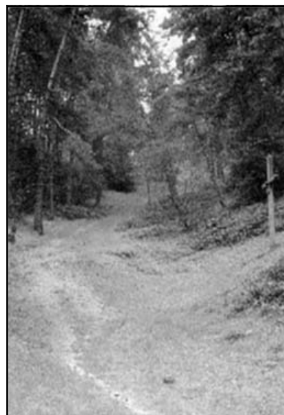
Страдецька Хресна Дорога, ст. 11-та, (світлина І. Божика)

якогось із хрестів прийде відчуття, як на серце сходить ласка. Дуже часто, коли прочани жертвують Хресну Прощу Отцю Предвічному за всіх рідних чи близьких і щиросердечно моляться за них, то відчують, як їх буквально щось притягує до Хреста. Виникає непереборне бажання увійти в Хрест, розчинитися в Ньому, злитися з Ним. Тоді настає та блаженна мить з'єднання зі Святим Хрестом, тоді вже не помічаєш ні часу, ні простору, тоді відкривається серце і сльози жалю, розкаяння заливають душу. Та благословенна мить може наступити на будь-якій стації, найголовніше, щоб вона прийшла, але для цього необхідно навчитися молитися серцем. Якщо часто здійснювати до Страдча Хресну Прощу весною, то можна запити, що лише на 8-ій стації, навколо