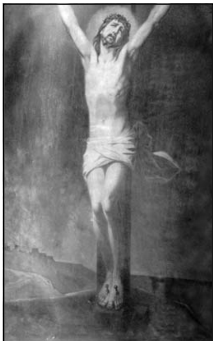
Старовинний образ Розп'ятого Ісуса. Ц-ва Успіння Матері Божої, с. Страдч

До нас у редакцію постійно поступає інформація про те, що відбувається на Хресній Дорозі у Страдчі. З достовірних джерел знаємо, що вже не один прочанин ставав свідком появи Хреста: білого чи жовтого. Те, що ти, дорогий читачу, побачиш на 3-ій сторінці обкладинки, лише ще раз підтверджує євангельську істину: блаженні ті, що не бачили, а увірували.