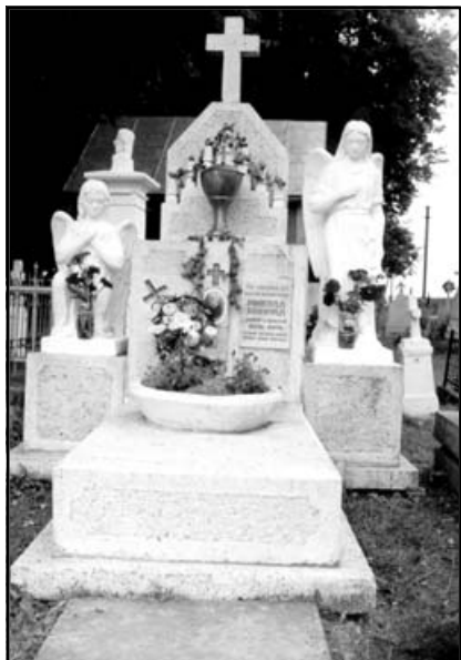
Могила мученика за католицьку віру бл. о.-д-ра Миколи Конрада