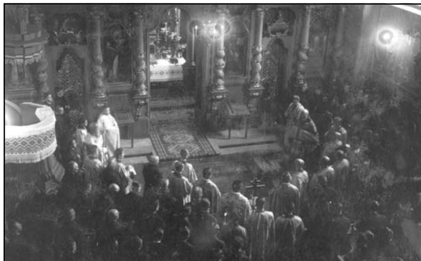
Внутрішній вигляд церкви Львівської Духовної Семінарії Св. Духа

(1946 р.). У 1947 р. Кир Йосип продовжив свій хресний шлях до Боїмів, де йому зламали в лазні руку. Того ж таки року Митрополит був перевезений до табору в Печорі. Місцевість ця відома своїм полярним кліматом. До табору Йосипу Сліпому довелося йти закутому в кайдани. В'язні тягнулися до місця призначення то залізничними рейками, то багнисною дорогою. У певний момент, коли вночі на повній швидкості над'їхав поїзд, вони лише чудом врятували собі життя. Конвой зіштовхнув їх із залізничних рейок вниз, і Митрополит, будучи прикутий кайданами до своїх двох товаришів поневолі, залишився живим. Перебування в Печорі було короткотривалим. У 1947 р. місце заслання змінилося на Інту (по сусідству з Північним Полярним колом), а від 1947 по 1953рр. Кир Йосип продовжив хресний шлях у Потьмі. Етап туди тривав місяць і повністю вичерпав сили знедоле-