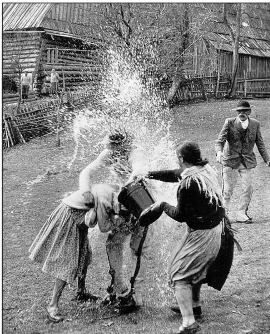
У давнину на поливаний понеділок

Французький король Карл Великий багато літ воював з варварами, намагаючись повернути їх у християнську віру, та всі його зусилля були марними.