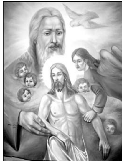
Художня робота Й. Терелі

Тоді я попросила Бога, аби показав мені, якою дорогою можуть наблизитися до Нього в наші часи