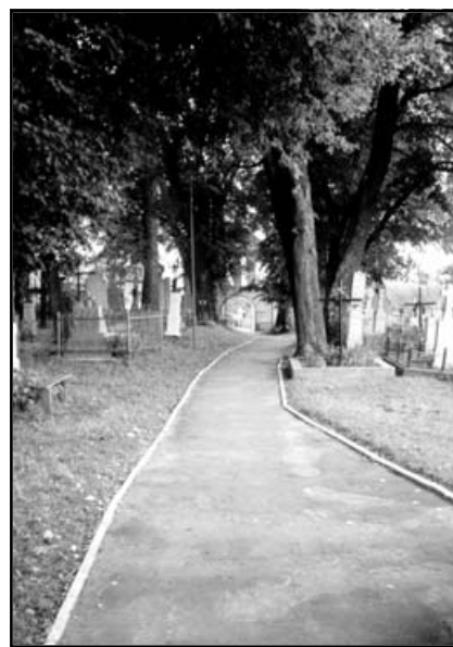
Страдч. Алея до храму