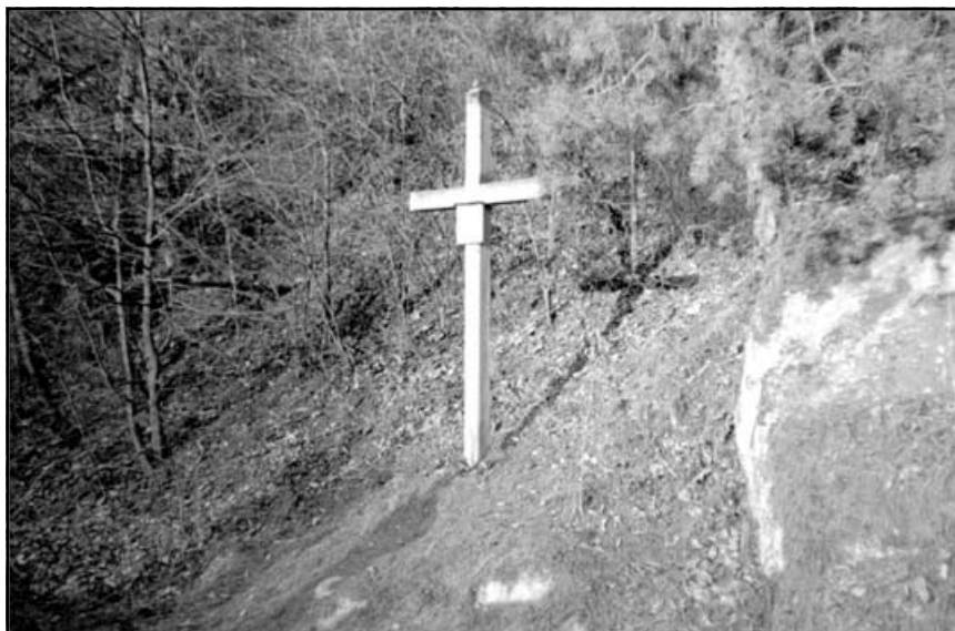
Страдецька Хресна Дорога, 8-ма стація

Спасителя з побожними жінками: "... Старші діти кинулися в ноги Господа Ісуса, цілували їх і брали землю з-під Його ніг, промовляючи: "Ця земля скроплена Твоєю Кров'ю і сльозами, наш найулюбленіший Отче. Наберемо її в посудину, посадимо в ній квіти і сльозами