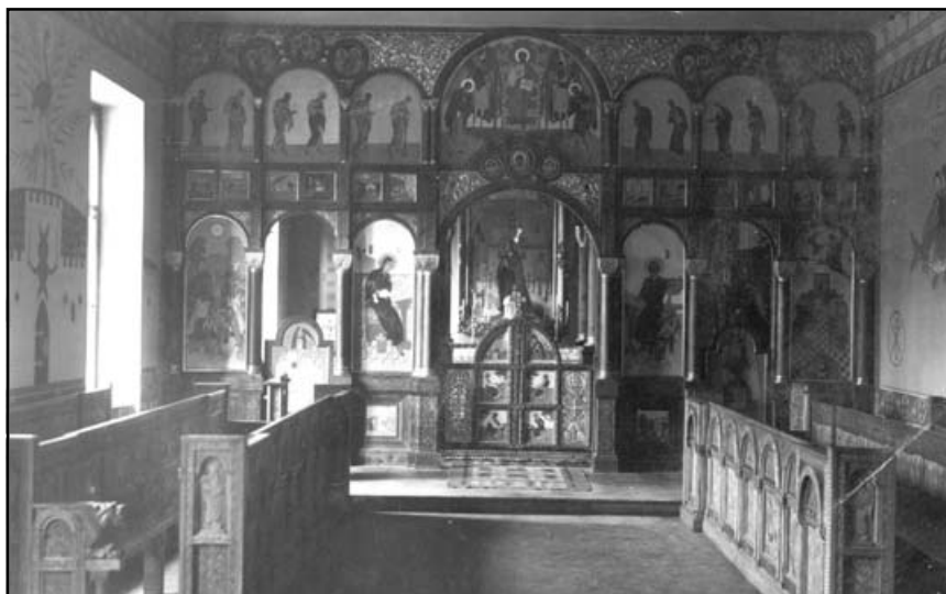
Львівська Духовна Семінарія Св. Духа. Внутрішній вигляд

їхніх душ (о. Миколи Цегельського та ін.). У 1950 р. Митрополита з гарячкою викликали на етап і знову відвезли на допити до Києва. Там радянська влада надаремно старалася нахилити його погрозами і обіцянками до зради УГКЦ. Також Владика не видав на допитах жодної інформації, яка стосувалася призначення нових адміністраторів Львівської Архiepархії, бо знав, що від його мовчання залежить майбутнє Церкви. Тож невдовзі його знов відправили до Потьми. Блаженніший у таборі сумлінно виконував свої душпастирські обов'язки: сповідав в'язнів та був для них духовною підтримкою у важку хвилину. Цей перший засуд тривав до 1953 р., поки Кир Йосипа не відвезли цього ж року до Москви, де з Митрополитом Сліпим мав розмову маршал Жуков.